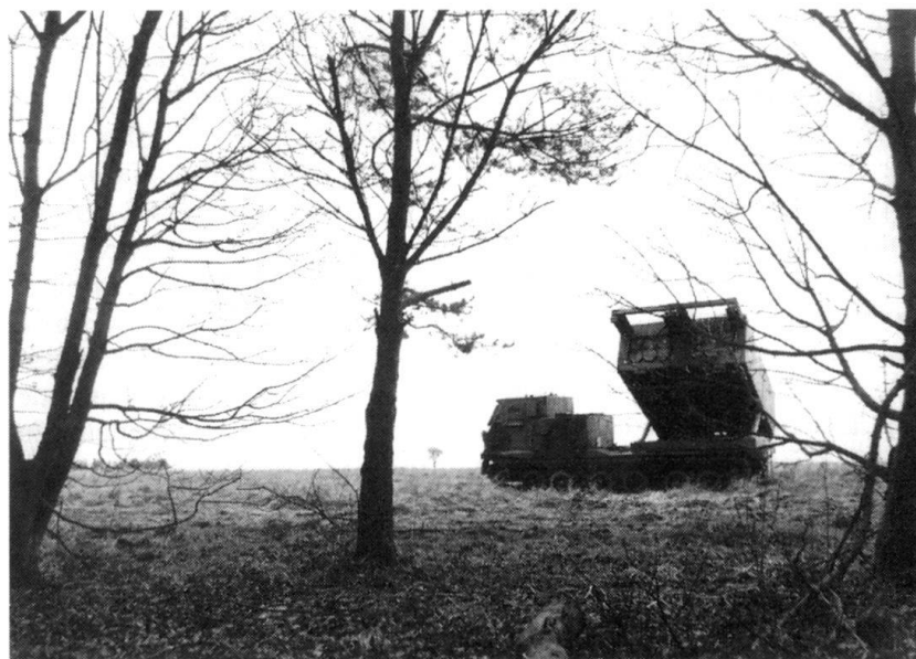
Le lance-fusées multiples de MLRS International Corp. équipe les forces armées allemandes, britanniques, françaises et italiennes.

Il devient nécessaire de trouver des solutions permettant de