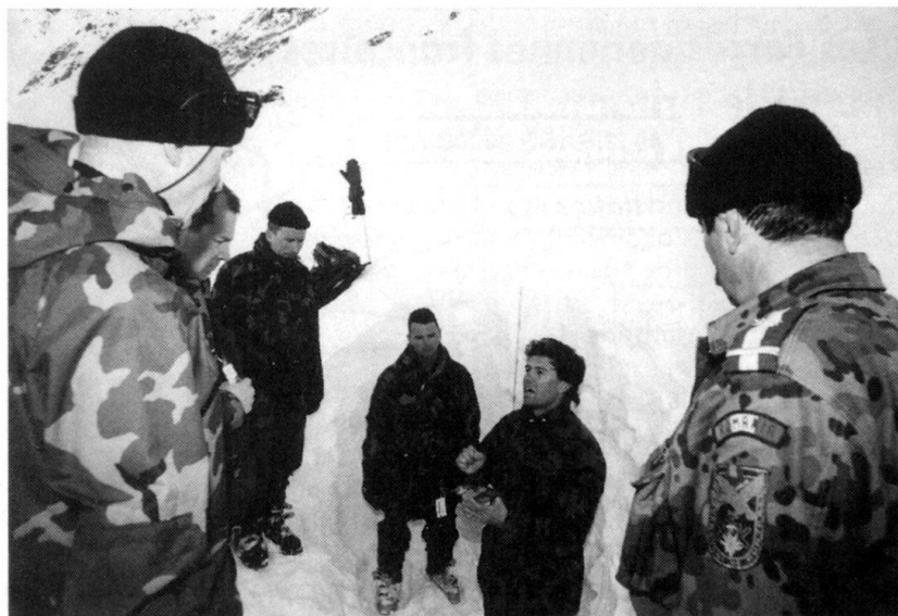
Roumains et Luxembourgeois à l'instruction du service avalanche.

Pour la première fois, l'armée suisse a organisé à Andermatt deux cours alpin, l'un d'hiver l'autre d'été, dans le cadre du Partenariat pour la paix. Durant les mois de février et de juin, une vingtaine d'officiers et de sous-officiers, venus de 12 Etats européens, ont travaillé avec les guides de montagne et les spécialistes de l'Ecole centrale pour le combat en montagne. L'accent était mis, pour le cours d'hiver, sur le service alpin et sur celui des avalanches. Les connaissances acquises ont été appliquées, la seconde semaine, dans un terrain difficile et dans des conditions délicates. Le cours d'été insistait sur la sécurité, le sauvetage; il a été couronné par l'escalade d'un sommet de 4000 mètres.