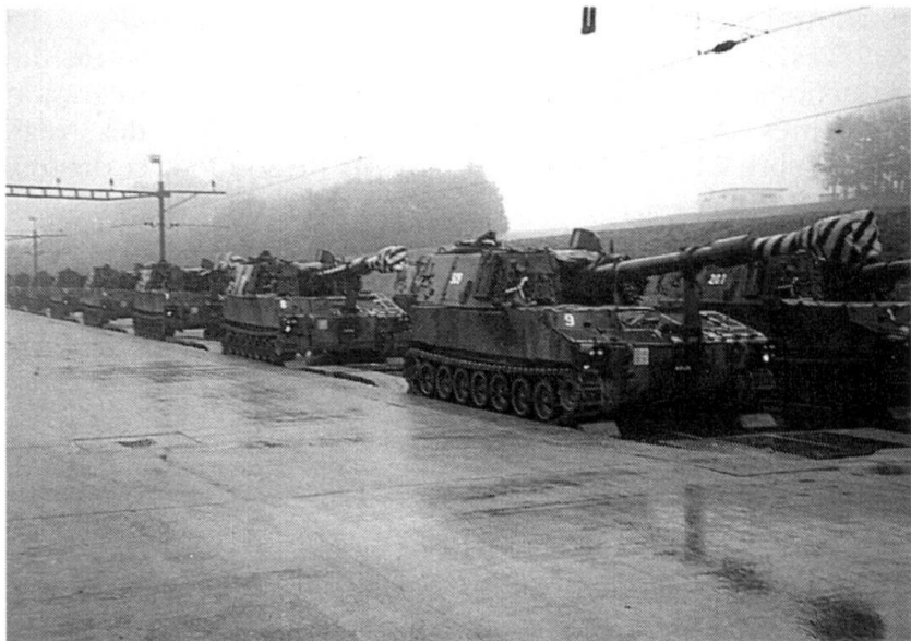
«Progress»: le régiment d'artillerie de chaque corps d'armée de campagne, équipé d'obusiers blindés M-109, sera subordonné à une division de montagne.

Malgré leur envergure, les dissolutions et les réductions annoncées au début février