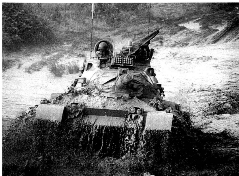
... 186 Char 68 non modernisés. Ici avec le simulateur de tir monté sur la tourelle.

Le rapport de la commission présidée par l'ancien secrétaire d'Etat Edouard