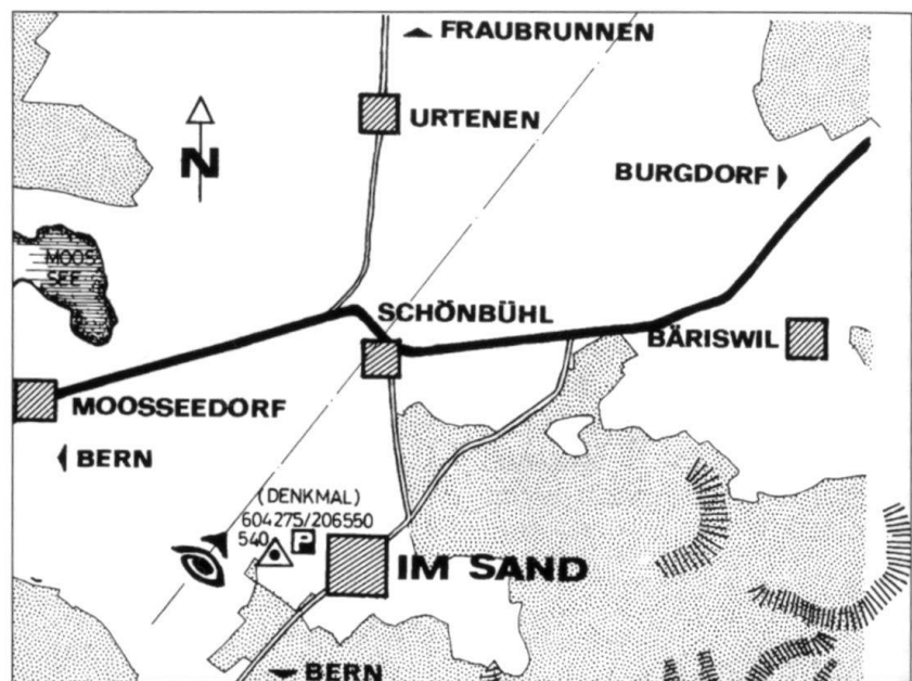
Croquis du terrain de la bataille du Grauholz.

Schauenburg atteint la rive Nord du lac de Biemme et de l'Aar, faisant face aux Bernois et aux Soleurois à Longeau, Büren et Nidau. Les échanges d'invectives sont fréquentes entre soldats des deux camps, donnant l'occasion aux officiers de sanctionner ces abus, «non conformes à l'honnêteté qui doit régner entre des militaires». Le 23 février, Schauenburg reçoit un ordre indiquant qu'il doit se tenir prêt à attaquer le 28 février au petit matin ce qui, selon lui, peut être exécuté sans problème.