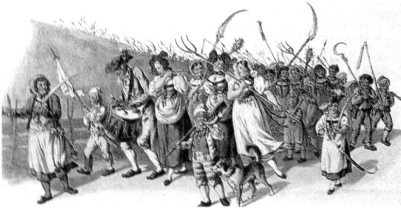
Le départ des femmes, des enfants, des vieillards pour combattre l'avance des Français.

Cette occasion, des personnalités provenant des localités les plus remuantes, Bâle et Lausanne, vont la fournir. Ce sont en particulier Frédéric César de Laharpe et Peter Ochs. Le Vaudois se trouve à la tête d'une délégation de ses compatriotes qui s'est rendue à Paris auprès du Directoire exécutif de la République française, en septembre 1797, venue demander la protection de la France à la Révolution vaudoise qui se prépare. Le 8 décembre se déroule à Paris un entretien réunissant le général Bonaparte, le Directeur Reubell et Pierre Ochs, fer de lance de la Révolution bâloise qui se prépare également. Au cours de cet entretien, dont il n'existe pas de compte-rendu, il ne fait aucun doute qu'il a été question de la Suisse et de sa révolution.