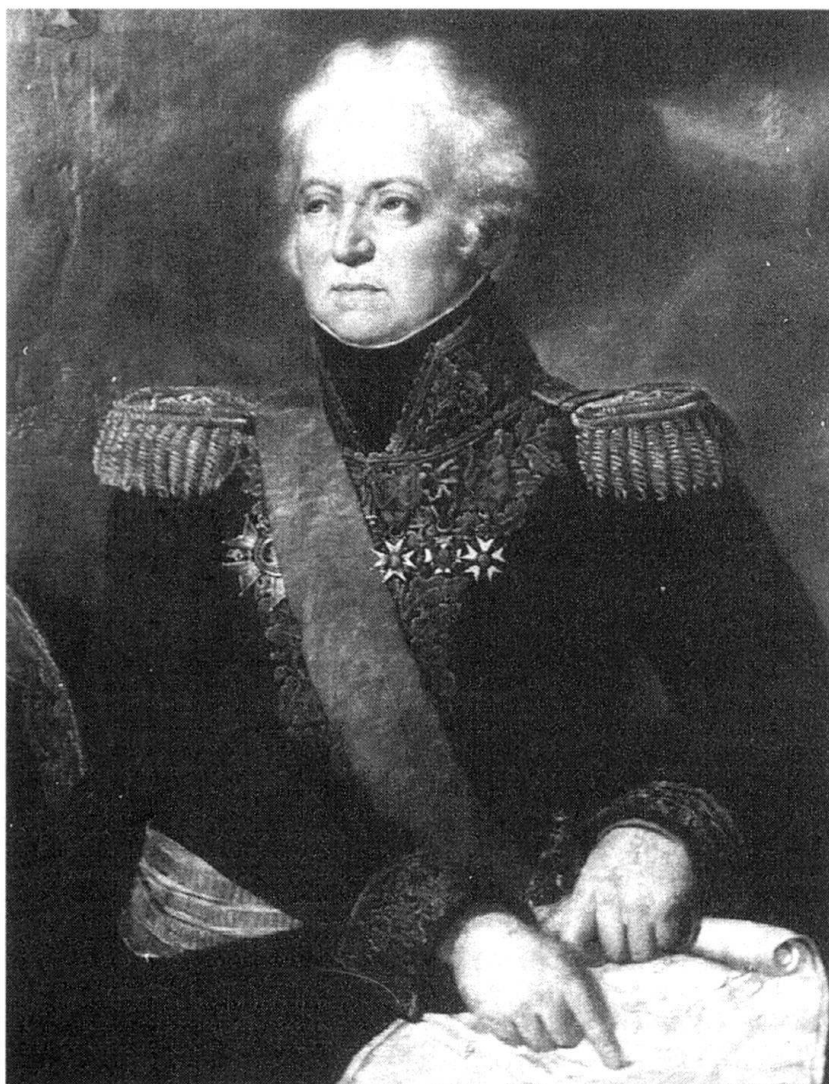
Le lt-général baron de Schauenburg.

Deux forces s'opposent: d'un côté une armée de milice, de l'autre une armée de métier. La première, mal encadrée, constituée surtout d'infanterie, sans cavalerie ou presque et n'ayant que