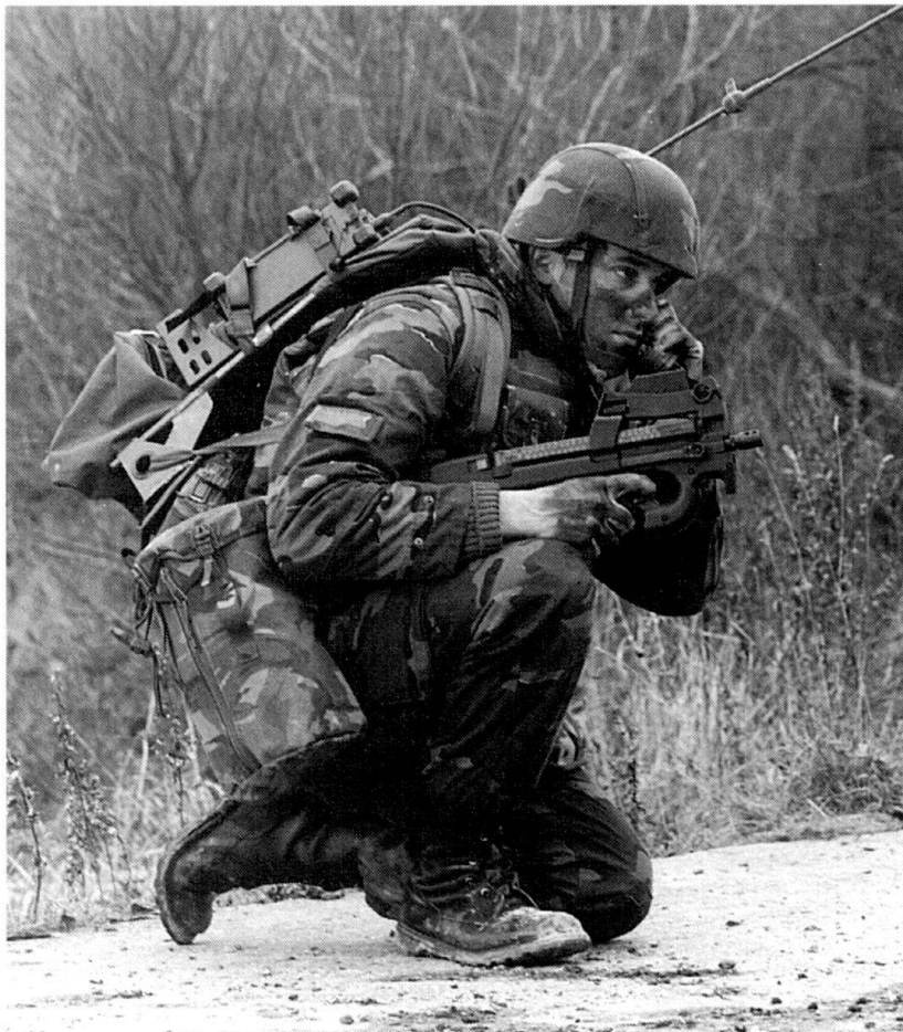
Bien qu'ayant le doigt sur la détente, ce qui représente une faute de sécurité, ce soldat radio belge est l'un des utilisateurs militaires potentiels du P 90.

dont le combat au fusil n'est pas la fonction primaire, ainsi qu'aux forces spéciales. Apparu sur le marché voici quatre ans, le P 90 a déjà conquis 14 Etats sur trois continents et est en cours d'évaluation dans 30