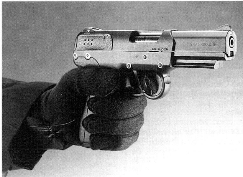
Le pistolet de demain ? L'acceptation du 5.7 x 28 mm par l'OTAN pourrait amener de nombreux fabricants à se tourner vers ce calibre. Mais FN a déjà une longueur d'avance avec le Five-seveN.

« Respecter la liberté, ce n'est pas accepter que les autres renoncent à la liberté. »