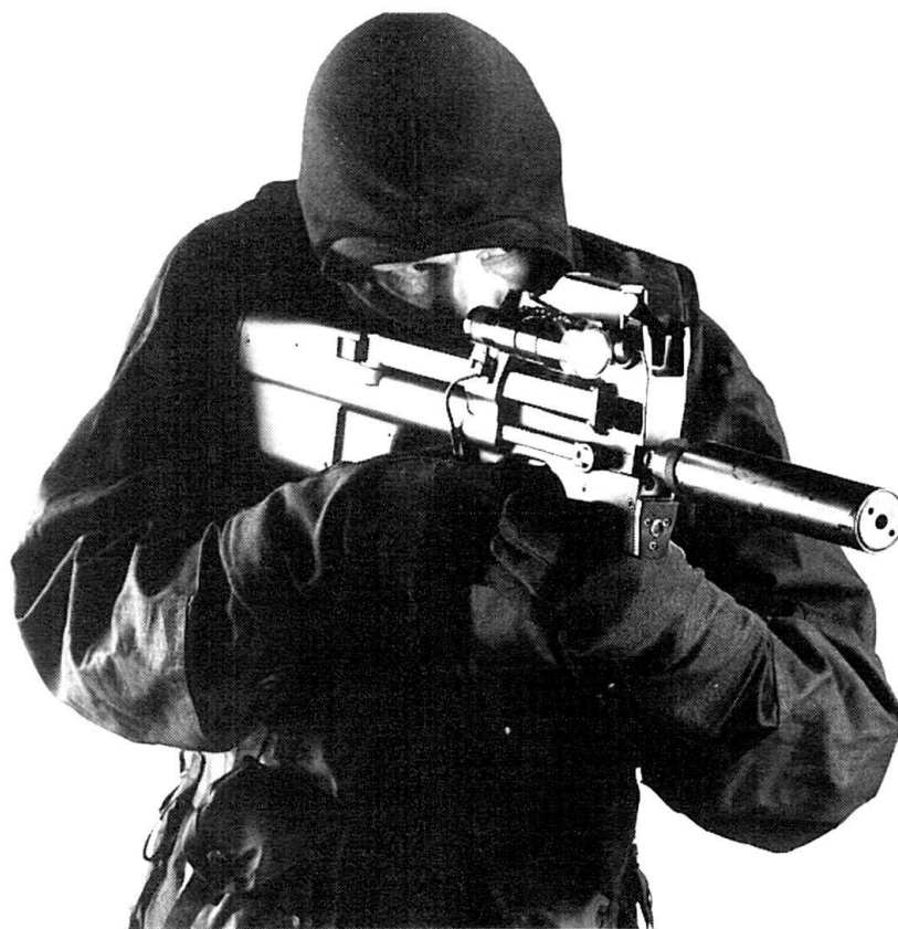
La diversité des accessoires et le faible encombrement de l'arme en font un outil apprécié des forces spéciales (Photo FN).

La première impression, l'arme en main, est sa remarquable ergonomie. Le changement de magasin, au sujet duquel nous avons précédemment émis quelques réserves 1 , s'effectue sans peine. La visée optique, très simple d'emploi, facilite l'usage en luminosité réduite. Quelques exercices de pointage et le système est acquis par le tireur. Il en va de même pour le démontage, moins de 20 secondes suffisant à séparer les trois groupes d'assemblage, soit 6 pièces en tout, plus le magasin.