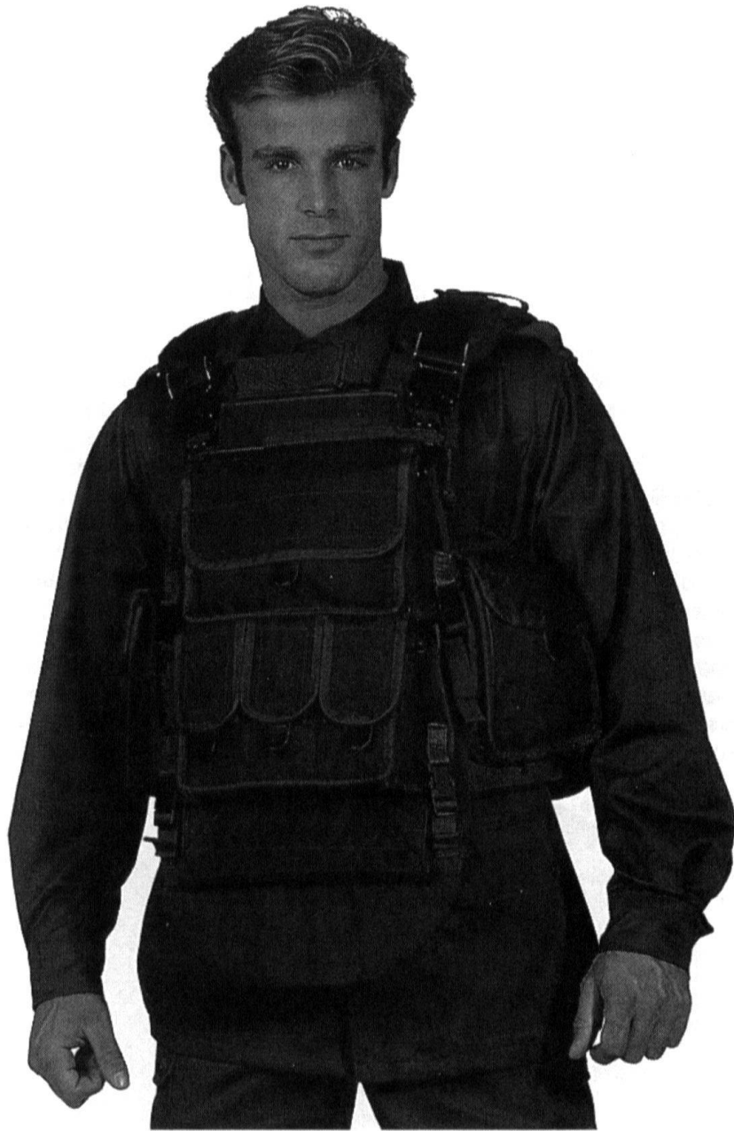
Le gilet balistique de combat Comoditex.

Le problème des gilets balistiques est leur intégration dans le harnais de combat. Généralement, ils ne sont pas conçus pour être portés ensemble. La maison Comoditex présentait à Eurosatory un gilet combiné avec un harnais de combat modulable. Etu-