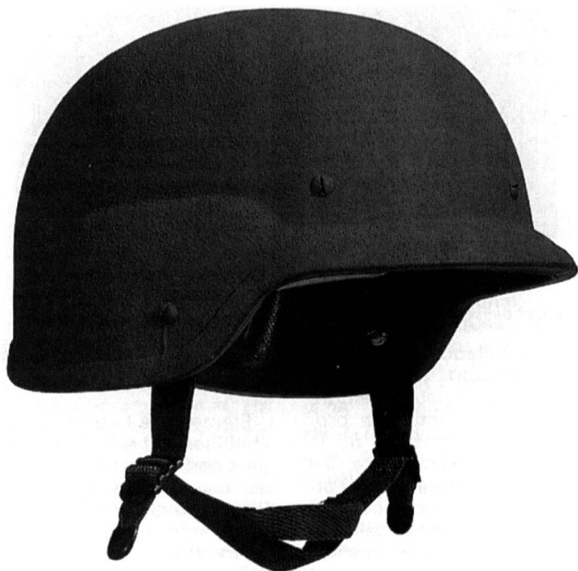
Le casque PASGT, qui équipe nos observateurs en ex-Yougoslavie.

Le casque et l'arme comportent tous deux une caméra vidéo. La visière du casque est un écran à cristaux liquides semi-transparent. Elle permet de superposer à l'image réelle une image vidéo – par exemple, thermique – ou en fausses couleurs, afin de détecter les camouflages. Par ail-