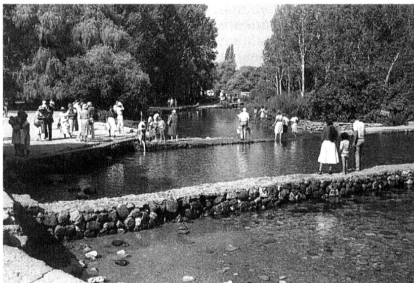
Les sources du Jourdain. La répartition des eaux du fleuve peut être une cause de tensions entre la Syrie, la Jordanie et Israël...

On trouve sur la planète 214 bassins fluviaux ou lacustres internationaux, dont 155 situés sur 2 États, 36 en touchent 3, tandis que les 23 derniers en touchent jusqu'à 12. Si le trafic fluvial international a commencé à être réglé dès le Congrès de Vienne en 1815, l'utilisation de l'eau par les pays concernés ne découle d'aucune règle établie. Un État a-t-il le droit, au nom de la souveraineté nationale, de garder pour lui les eaux de ses cours d'eau, du moins une partie importante, afin de satisfaire ses propres be-