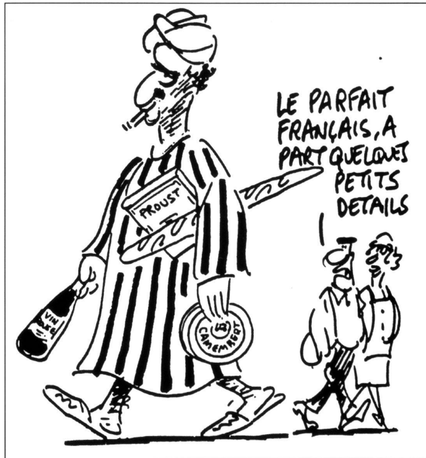
Libre Journal N° 24-24. Dessin d'Hoviv.

En revanche, la majorité des vols de matières premières, parfois stratégiques, dans les entreprises