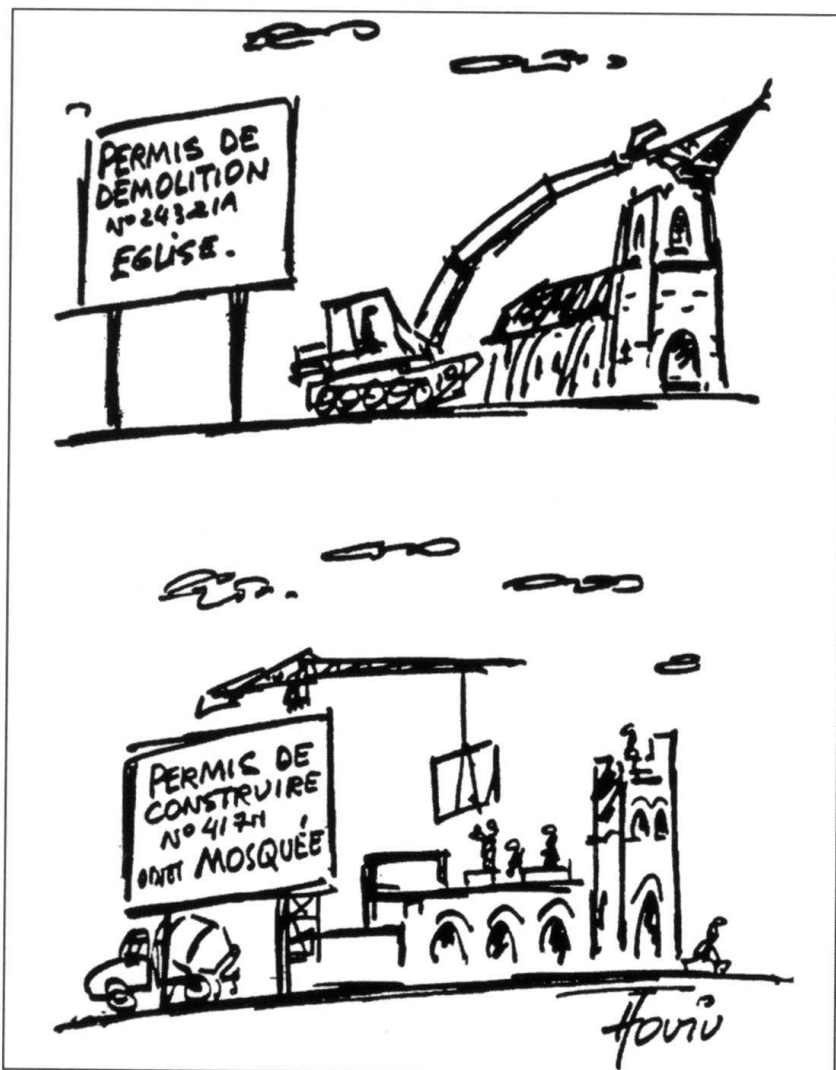
Libre Journal N° 24-24. Dessin d'Hoviv.

A côté des mafias italiennes, il faut citer les triades chinoises (en Suisse, l'écras-