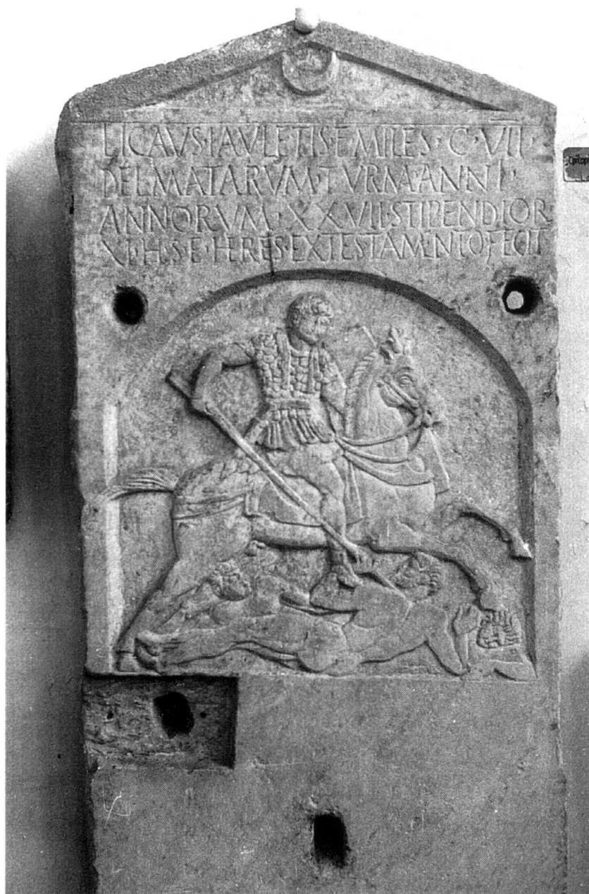
Cavalier auxiliaire dalmate servant en Afrique du Nord. Armée professionnelle, l'armée romaine était aussi internationale. II e s. ap. J.-C., Stèle funéraire trouvée à Cherchel, Musée d'Alger.

prend une ampleur inégalée. Les Germains se forment en confédérations nouvelles (Francs et Alamans) qui attaquent sur le Rhin. Les Goths poussent sur le Danube. La dynastie sassanide lance les Perses contre l'Empire. Partout les légions sont débordées. Les barbares pénètrent pro-