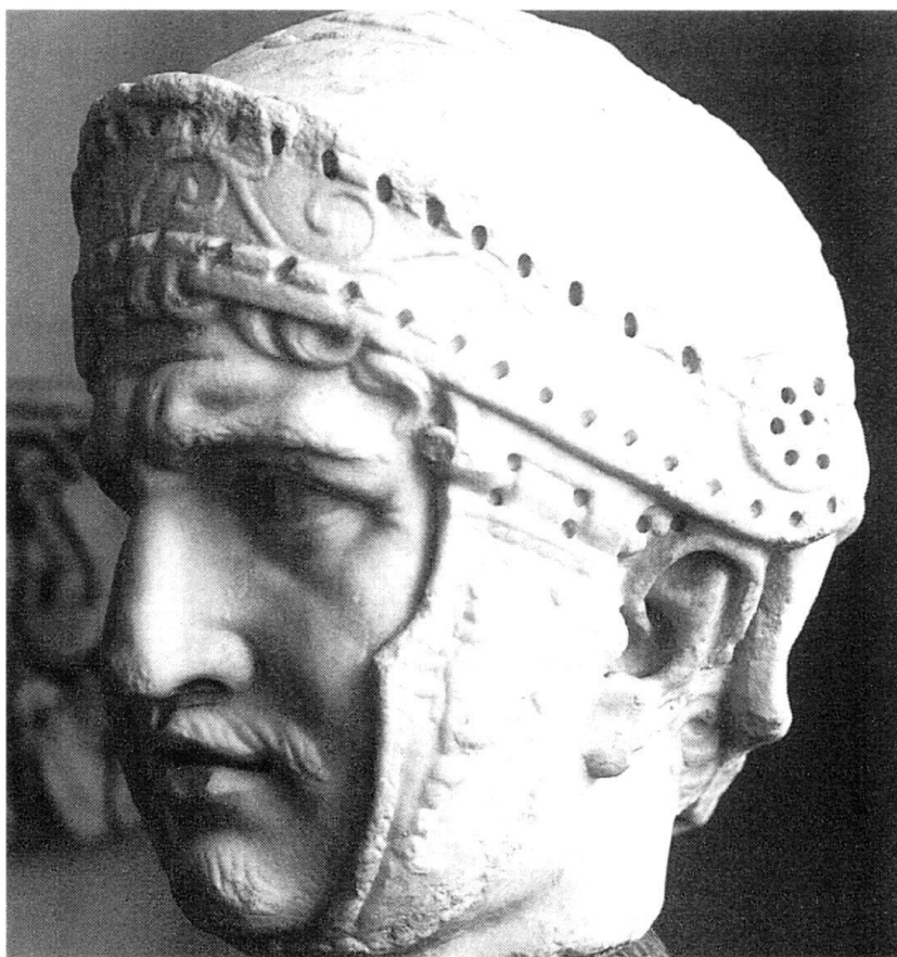
Tête de légionnaire. Staatliche Museen Berlin-Est.

L'Etat va ensuite proposer un paiement en argent de l'impôt sur les recrues, à la place de l'acquittement en nature, si mal accepté. L'argent ainsi perçu alimente une autre tare de l'armée du Bas-Empire romain. Au IV e siècle, les barbares, demandeurs d'intégration, et forts de leurs traditions guerrières, s'engagent de plus en plus, à titre individuel ou par unités entières, particulièrement dans les troupes d'élite. Le barbare devient, non plus un ennemi mais un partenaire. Si les armes sont impuissantes contre lui, l'or sert à l'acheter pour défendre l'Empire. Ces mercenaires barbares sont souvent fidèles et impitoyables envers leurs