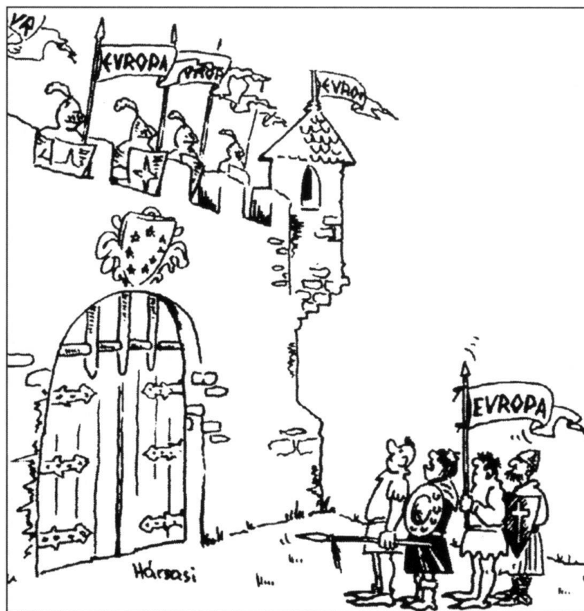
Les Etats de l'Europe de l'Est et l'Union européenne vus par le périodique militaire hongrois Honvédségi Szemle.

Jusqu'en 1989, l'Allemagne se trouvait en première ligne du front Est-Ouest, adossée au Mur de Berlin, partie d'un ensemble qui s'articulait autour du Rhin. Elle se retrouve au cœur d'un continent dont le centre de gravité s'est déplacé. Symbole de ce déplacement, le transfert de sa capitale de Bonn à Berlin. L'Allemagne n'est plus aussi nettement orientée vers l'ouest du continent. A nouveau, comme au XIX e siècle et dans la première moitié du XX e siècle, elle jette un regard tous azimuts et s'interroge sur la manière d'aménager ses relations et sur des modes de coopération possible avec les pays