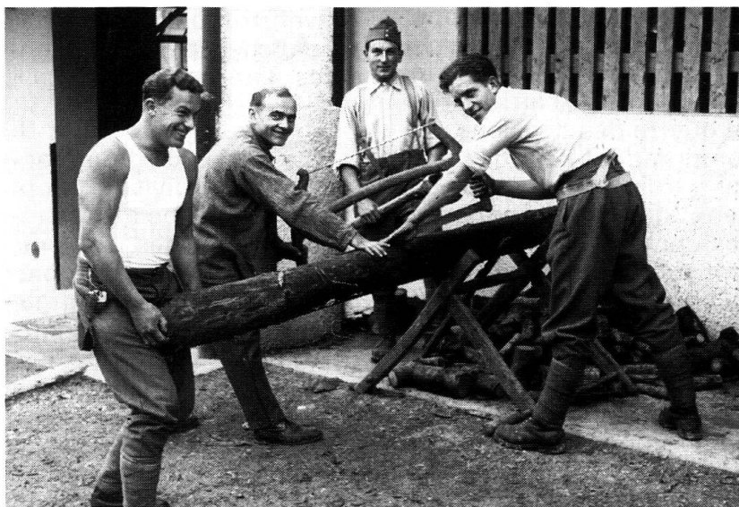
Un groupe prépare du bois de feu dans le dispositif de la Brigade frontière 3 pendant le service actif 1939-1945. L'édification de fortifications, le service de garde sont monotones, ce qui explique des périodes de démoralisation.

– un détachement, voire une formation plus impor-