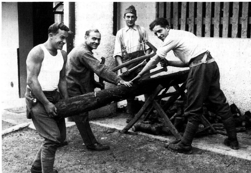
Un groupe prépare du bois de feu dans le dispositif de la Brigade frontière 3 pendant le service actif 1939-1945. L'édification de fortifications, le service de garde sont monotones, ce qui explique des périodes de démoralisation.

- un détachement, voire une formation plus impor-