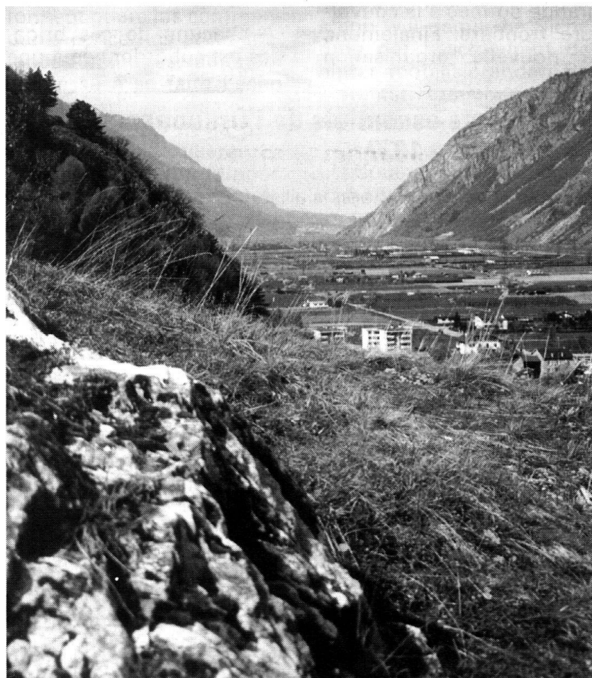
Une position frontière clé, Martigny. Vue de la vallée en direction de Saint-Maurice