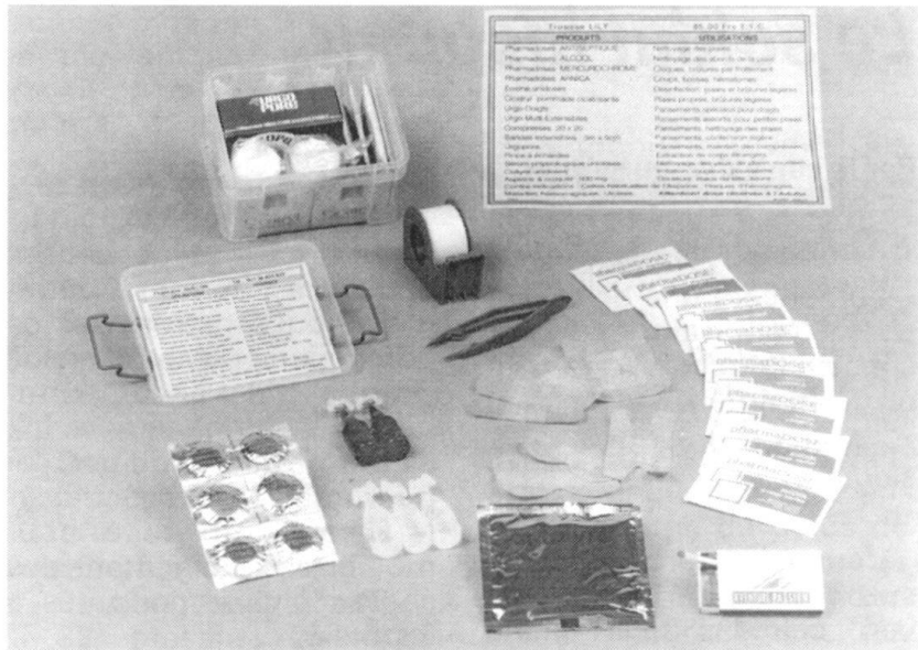
Un exemple parmi d'autres de la modularité FISU.

Développée dans une optique de maintien de l'ordre, cette barrière a également trouvé grâce auprès de plus de vingt armées dont celle de Grande-Bretagne, des Etats-Unis, d'Espagne et d'Allemagne.