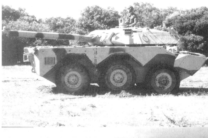
AMX 10 RC.

Le gilet pare-balles est essentiel pour la psychologie et pour la protection. Son ergonomie devrait être revue, car on cale difficile-