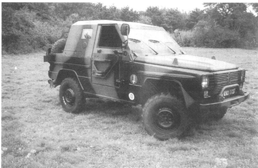
Panhard a développé un «Kit» de protection pour le Véhicule léger tout terrain P4 4 x 4.

les autres. A ce soldat, il ne faut pas laisser le temps de trop penser, il faut l'occuper en permanence à des activités qu'il maîtrise parfaitement. Un plus pourrait être apporté dans l'accoutumance des hommes, en particulier des cadres, à l'horreur: un homme blessé qui souffre, un enfant déchiqueté peuvent, au mauvais moment, faire perdre ses moyens à un homme et, partant, mettre sa vie en danger. Un stage de quelques jours en SAMU pendant la formation à Coëtquidan ou à Saint-Maixent ne serait pas inutile.