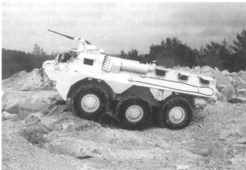
Véhicule de l'avant blindé (VABNG).

Cependant, la semaine précédant le 17 juin a été particulièrement bénéfique pour la préparation au combat du groupement, ce qui lui a permis d'affronter l'épreuve du feu dans les meilleures conditions de cohésion. Les missions remplies du 9 au 16 juin avaient déjà appris aux sections à travailler ensemble, puisque l'on a «bî-nômé» une section VAB et une section VLRA.