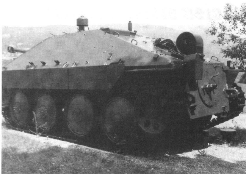
Chasseur de chars G-13.

Malgré l'ouverture d'esprit de certaines de ses têtes pensantes et la clairvoyance de «prophètes»