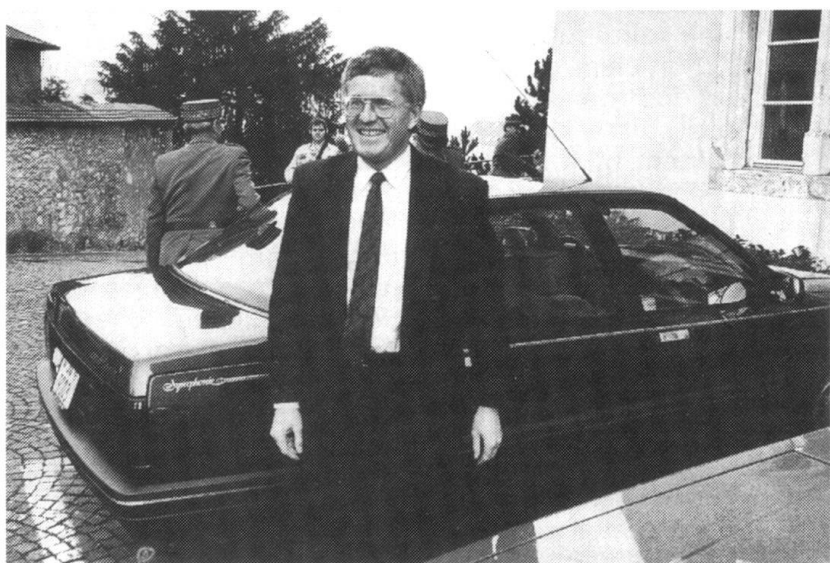
Le conseiller fédéral Villiger ne présente pas le projet «Armée 95» comme une solution de transition. Il dit, au contraire, que l'Armée 95 sera à même de s'adapter à des conditions nouvelles.

Un Comité central de la SSO, qui comprend sa mission, doit prendre de l'avance sur son temps et voir loin. Il s'entourera de groupes de travail capable de l'aider dans sa réflexion. Qu'à ce niveau, on pense déjà à 2010, voilà qui semble normal. Ce groupe restreint d'«initiés» livrera ses conclusions au Département militaire fédéral, pour l'aider dans son travail de planification à long terme, mais sans le crier sur les toits.