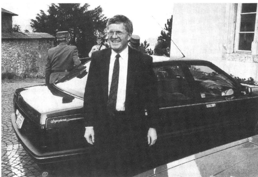
Le conseiller fédéral Villiger ne présente pas le projet «Armée 95» comme une solution de transition. Il dit, au contraire, que l'Armée 95 sera à même de s'adapter à des conditions nouvelles.

Un Comité central de la SSO, qui comprend sa mission, doit prendre de l'avance sur son temps et voir loin. Il s'entourera de groupes de travail capable de l'aider dans sa réflexion. Qu'à ce niveau, on pense déjà à 2010, voilà qui semble normal. Ce groupe restreint d'«initiés» livrera ses conclusions au Département militaire fédéral, pour l'aider dans son travail de planification à long terme, mais sans le crier sur les toits.