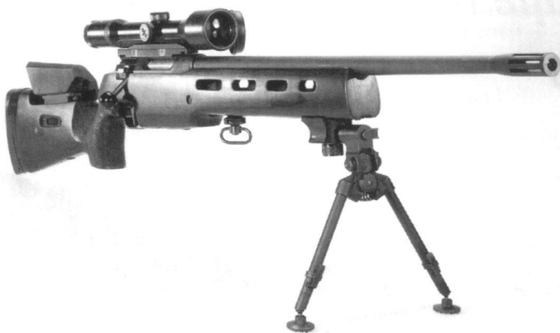
Parmi les entreprises présentées aux congressistes, SIG et sa carabine de tireur d'élite modèle SSG 3000.