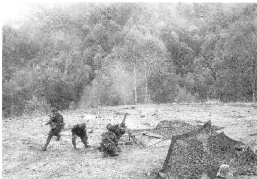
«Coup parti». L'école de recrues d'Isonne a présenté grenadiers et canonniers de façon très dynamique.