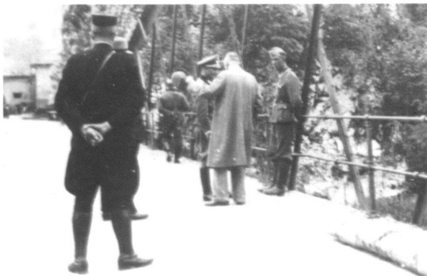
Pont de Biaufonds, sur le Doubs, entre Maïche et la Chaux-de-Fonds. Discussion entre autorités suisses et allemandes. (Mai 1940. Coll. particulière).