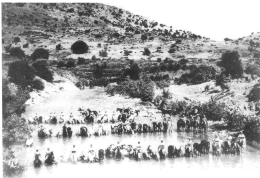
La vieille Légion. Escadron du 1 er Régiment Etranger de cavalerie faisant boire ses montures dans un oued.

Le 1 er novembre 1939, la Légion crée un nouveau régiment, destiné à combattre sur le continent, au fameux camp de la Valbonne bien