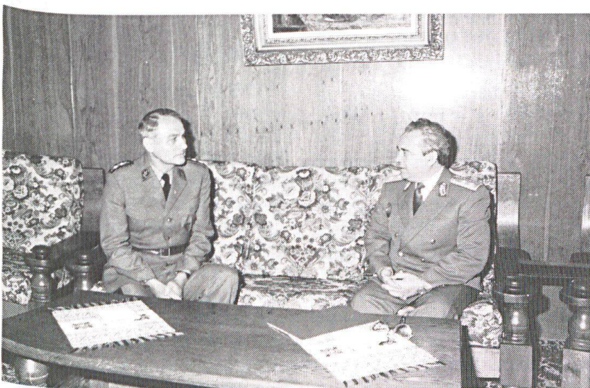
...En conversation avec le ministre roumain de la Défense.

L. G.: Ces exercices font partie de l'échelon tactique; le domaine opératif n'est