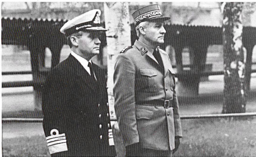
A Berne, en compagnie de l'amiral Kein de Norvège.

pas concerné, car l'on y exerce un échelon inférieur.