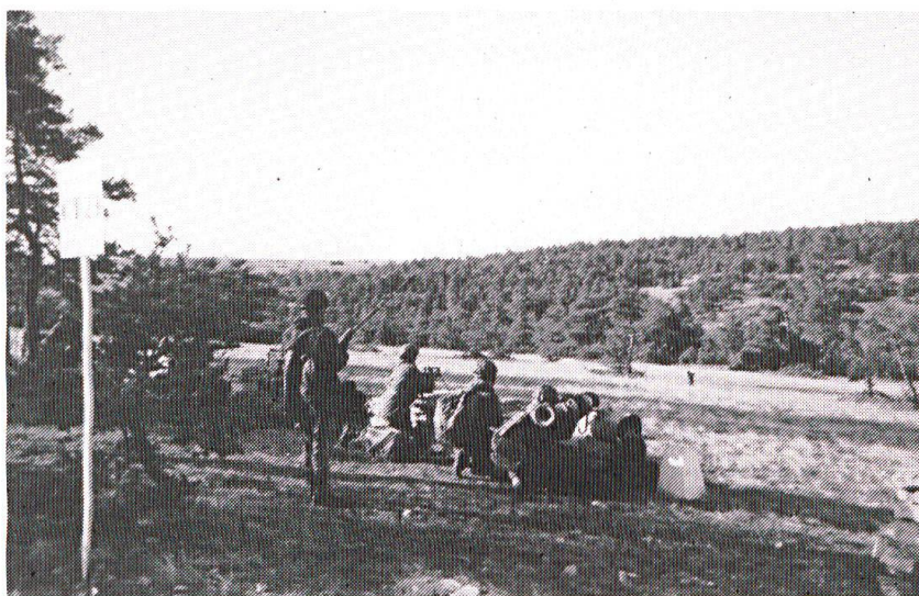
Un emplacement de tir lors du parcours offensif. Le cadre en retrait est l'un des contrôleurs chargé de la sécurité.

Chaque compagnie passe au Centre environ une fois