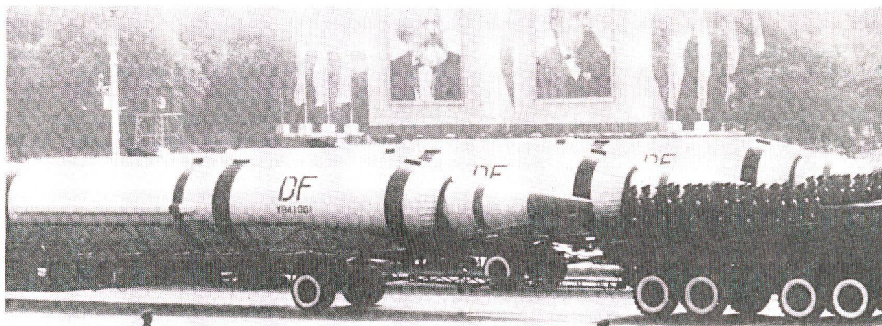
Trente de ces missiles chinois CSS-2 ont été vendus à l'Arabie Saoudite...

dissuasion crédible, efficace et peu coûteuse.