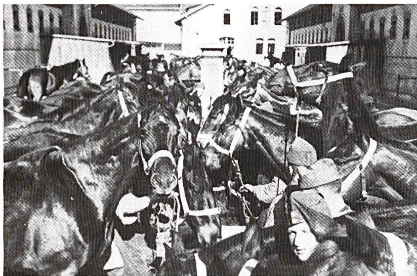
Aarau. Un escadron à l'abreuvoir.

pieu à terre». La cavalerie n'était plus nécessaire; elle n'était même plus guère viable. Il serait pourtant injuste qu'on ne garde d'elle qu'un souvenir folklorique. Pendant des siècles, elle a été l'Arme de la décision; l'esprit cavalier, fait de hardiesse et de vues lointaines, a inspiré de grands capitaines. La nostalgie des anciens est donc justifiée, car elle ne se nourrit pas seulement du charme qu'il y avait à servir à cheval. Aujourd'hui il importe qu'ils aident leurs après-venants, qui «montent» des chars, à ressentir le même feu sacré.