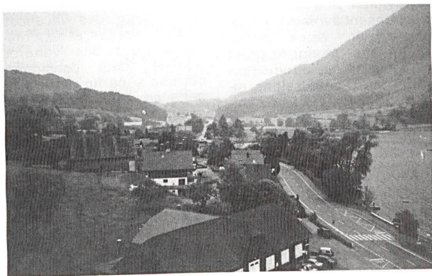
A droite, le lac d'Aegeri et la route en direction du défilé du Morgarten (à l'horizon).

Un tout autre problème est de savoir si cette armée 95 est réalisable, compte