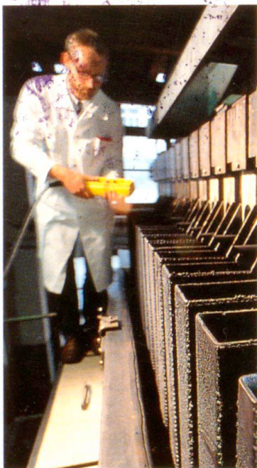
Installation d'électrolyse mise au point chez Sandoz: un ingénieur surveille la méthode appliquée depuis peu pour éliminer des métaux lourds (cuivre) des eaux contenant des résidus de colorants.

P révenir la formation de déchets, les valoriser ou les réduire dans la mesure du possible, tel est le souci permanent de tous les collaborateurs de Sandoz, qui entendent bien relever le défi qui leur est lancé.