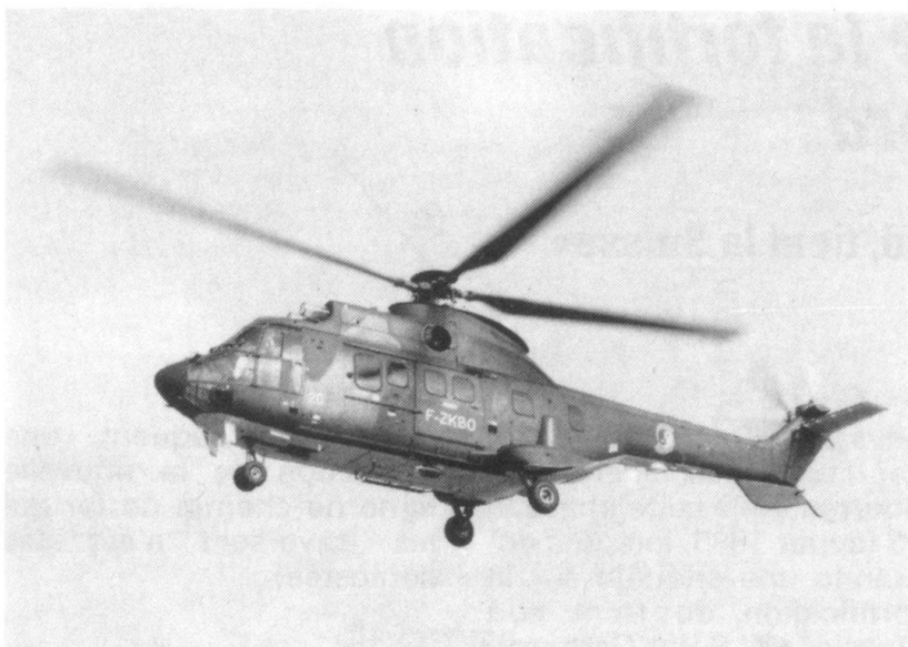
...ou s'il est disponible, l'hélicoptère. Ici un Super Puma.

fallait capturer dans une «gouille» puis griller du côté de Sanetsch, et la farine qu'il fallait transformer en pain à l'issue d'une longue marche, sous la