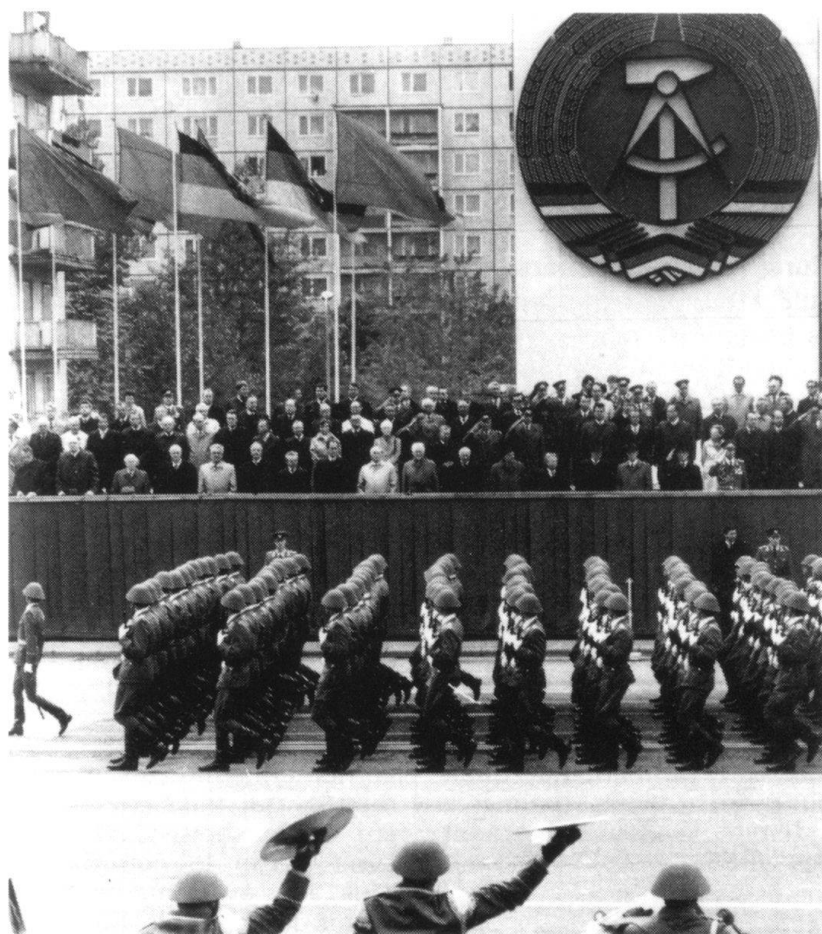
En 1986, une parade militaire à Berlin-Est pour célébrer le trente-septième anniversaire de la fondation de la République démocratique d'Allemagne. A droite, sur la tribune officielle, à côté d'un officier, l'«homme fort» du régime, Erich Honecker...

ce 1990, les dépenses ont été réduites de 62 à 52,5 milliards de marks, mais ce montant comprenait la prise en charge de l'appareil militaire de l'ex-RDA. Pour l'année à venir, le budget de la défense reste pratiquement inchangé (moins 34 millions), tandis que le budget fédéral augmente très fortement, s'élevant à 422,5 milliards de marks. Il est admis pourtant que l'armée doit aussi contribuer aux coûts énormes (155 milliards de marks par an) de remise en état des structures économiques et sociales de la partie orientale. Le ministre des Finances a prévu de diminuer chaque année les dépenses militaires de 1,5 milliard, ce qui est considéré comme tout à fait insuffisant par l'opposition SPD qui réclame, outre l'arrêt de tous les grands programmes d'armement, la réduction des effectifs de la Bundeswehr à 200 000 hommes 1 .