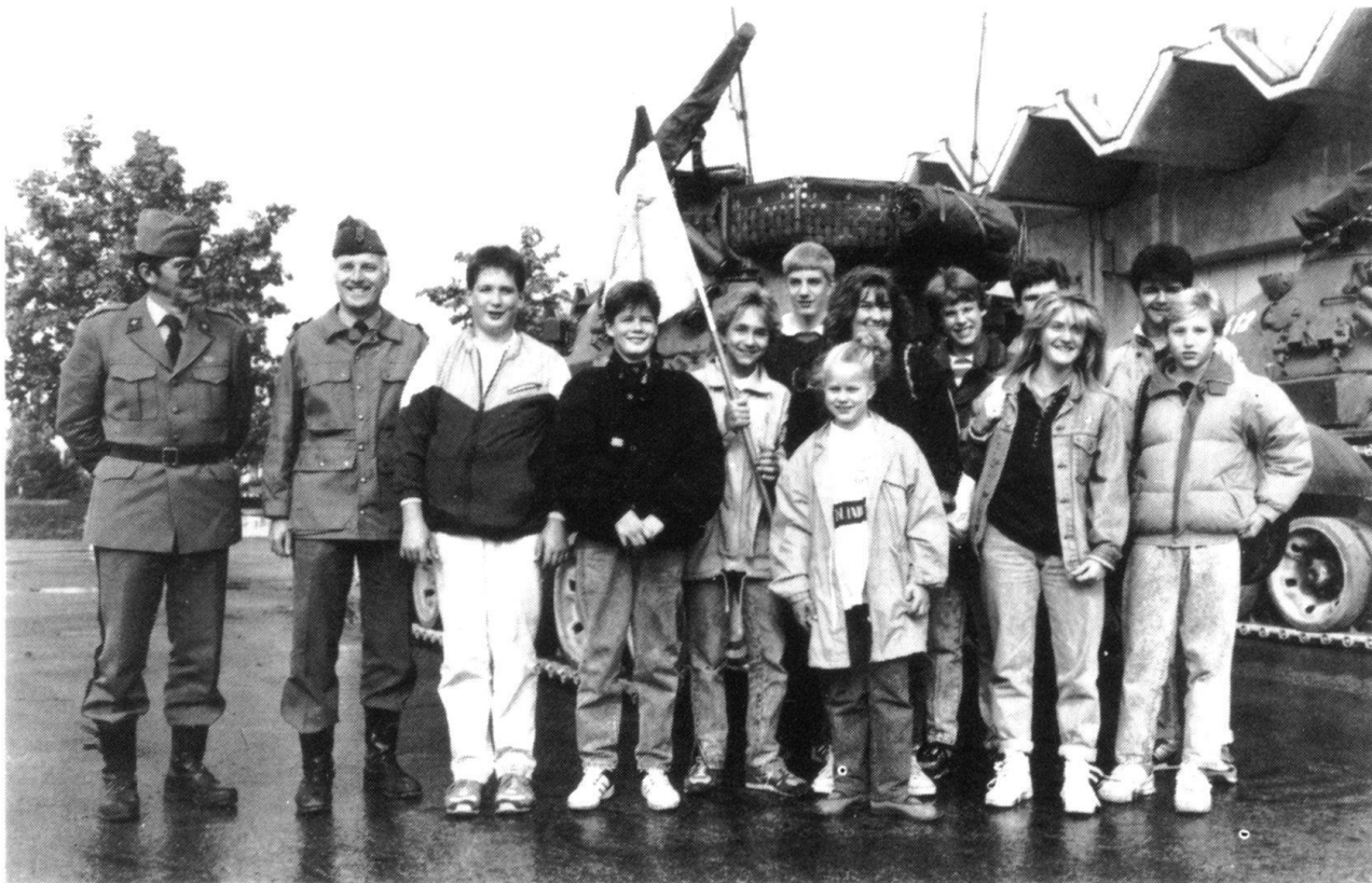
Le roi, la reine et les lauréats du tir des enfants à Zurich sont pour un jour les hôtes de l'armée: ici à Thoun, lors de leur visite aux écoles de chars.

Dans la société, ce sont les élus qui montrent le chemin, généralement selon une tradition économique ou politique corrigée par