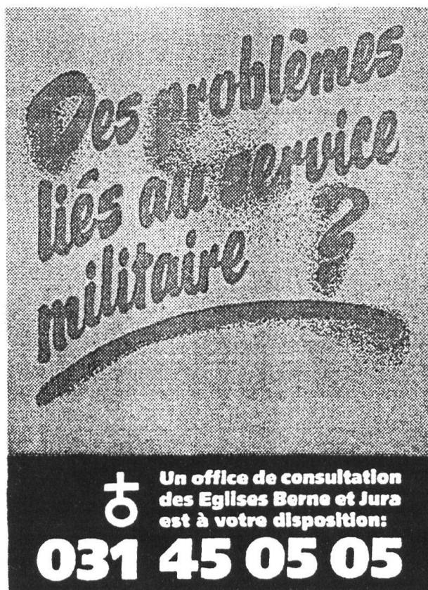
Affichette que l'on peut voir dans les transports en commun, entre autres, de Berne et de Bienne...

Dès lors, on a renoncé aux anciens offices ouverts aux seuls objecteurs qui déplaçaient à trop de gens et on s'est limité aux nouveaux «Offices de consultation ecclésiastique pour les problèmes liés au service militaire» qui doivent fonctionner dans chacun des 21 arrondissements ecclésiastiques. Cette organisation comptait, au moment du démarrage, le 3 septembre 1990, 11 conseillers disponibles (pasteurs, psychologues, etc.) dans 10 des 21 arrondissements.