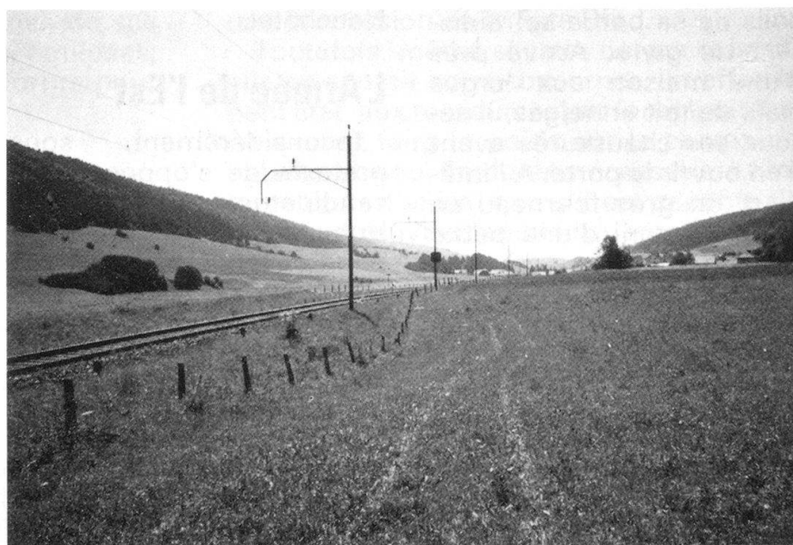
Le même endroit aujourd'hui (août 1990).

moire, telles des photographies, les scènes qu'il découvre à chaque pas dans la neige: des malheureux agglutinés autour d'un feu minuscule fait du bois des barrières de jardin, un cheval qui tombe, foudroyé par l'épuisement et le froid, un officier pâle et défait sous son casque de cuirassier, des vieux briscards que plus