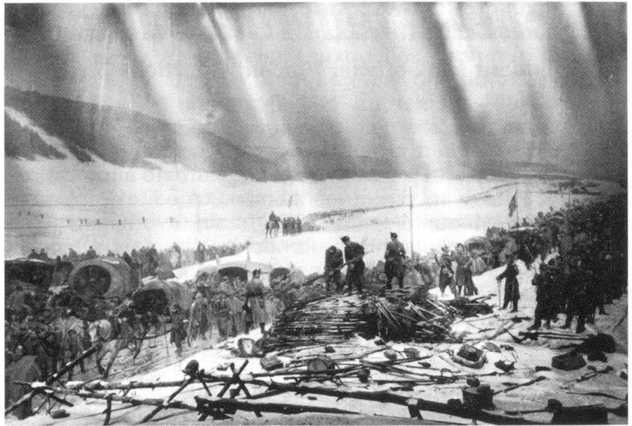
L'Armée de l'Est dépose ses armes. Panorama-Bourbaki (1 er février 1871).

Edouard Castres, le peintre, se trouvait là, au milieu des 88 000 hommes de l'Armée de l'Est, avec son fourgon-ambulance. Témoin éclairé et acteur de cette tragédie, il grave dans sa mé-