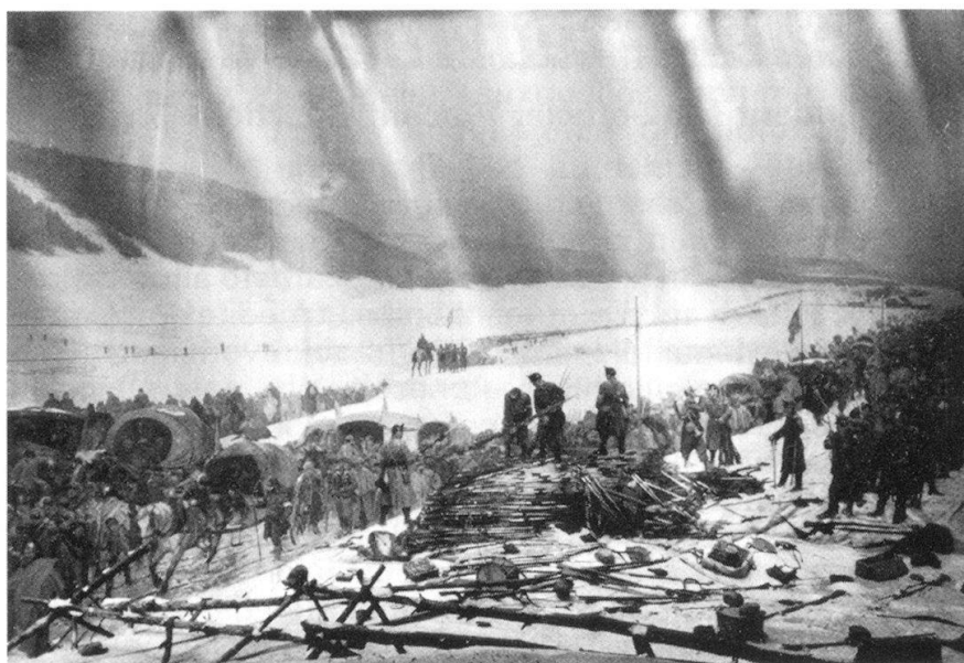
L'Armée de l'Est dépose ses armes. Panorama-Bourbaki (1 er février 1871).

Edouard Castres, le peintre, se trouvait là, au milieu des 88 000 hommes de l'Armée de l'Est, avec son fourgon-ambulance. Témoin éclairé et acteur de cette tragédie, il grave dans sa mé-