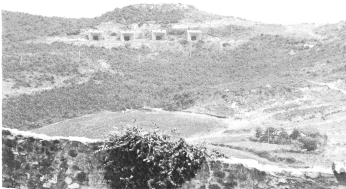
Position enterrée d'une batterie d'artillerie

Les hommes et les femmes sont astreints à effectuer une école de recrues, puis chaque année un cours de répétition de deux semaines. Leurs uniformes, armes et maté-