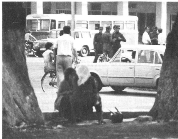
Groupe de soldats

D'après les bribes d'avis rassemblés sur le sujet, il semble que l'armée compte une forte proportion de troupes territoriales, chargées de défendre une portion déterminée de la géographie, la masse de manœuvre étant plus restreinte, en nombre