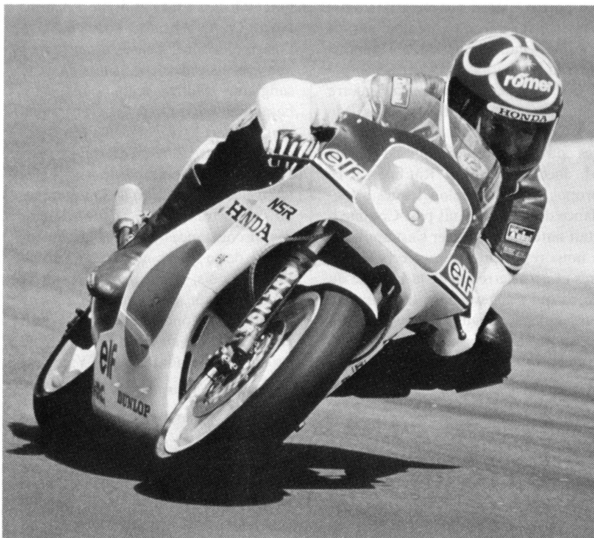
Jacques Cornu, champion du monde d'endurance, 4 fois champion de Suisse, 3 victoires en Grand Prix et de nombreux autres succès... a choisi de vivre dans le canton de Neuchâtel.