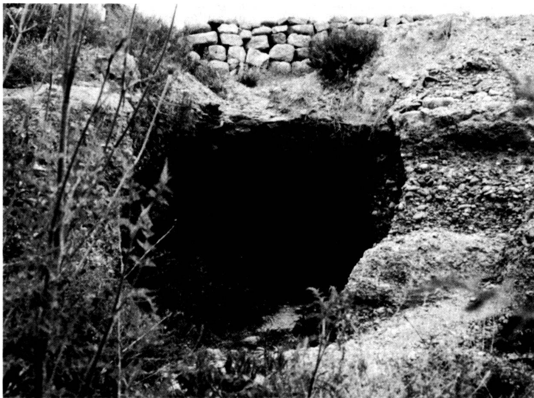
Le tunnel, à la hauteur de la cavité

défenseurs creusèrent plusieurs tunnels sous leur mur et la rampe dans laquelle ils aménagèrent une cavité remplaçant la terre par un échafaudage de bois auquel ils mirent le feu, créant ainsi un éboulement de la rampe destiné à faire basculer les tours de l'adversaire.