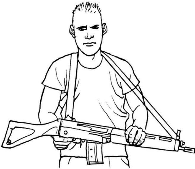
Figure 3: sangle autour de la nuque.

La troisième ne protège pas très bien l'arme d'une saisie indésirable. Elle offre cependant l'avantage: