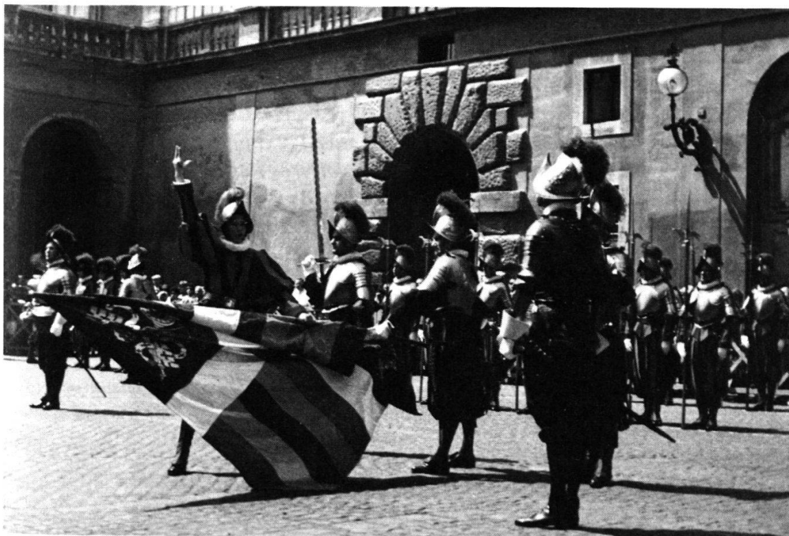
Prestation de serment lors d'un 6 mai, moment solennel et émouvant non seulement pour les jeunes recrues, mais également pour les parents, amis et invités qui vivent la cérémonie dans la cour Saint-Damase.