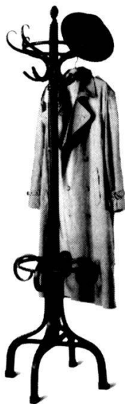
Mardi 14 h 15