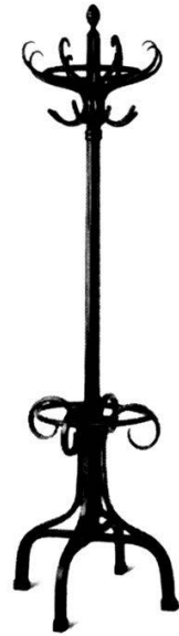
Vendredi 14 h 15

Pour certaines questions délicates, les clients préfèrent souvent être conseillés dans leur entreprise ou même chez eux. Nos collaborateurs du service externe ont donc des journées très variées qu'ils peuvent organiser librement. Bien formés et experts dans leur domaine, ils prodiguent aux clients des conseils judicieux qui font la réputation de la «Winterthur». Etes-vous tenté de devenir collaborateur de notre service externe? Alors, n'hésitez pas à vous renseigner auprès de nous.