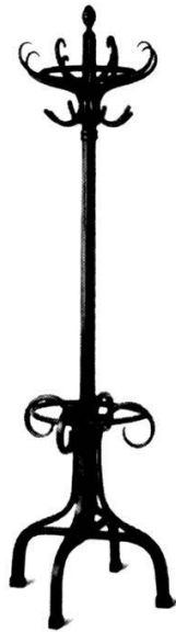
Jeudi 14 h 15