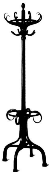
Lundi 14 h 15

Si vous travaillez à la «Winterthur», il se peut que vous ne soyez presque jamais dans votre bureau.