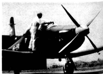
PC-9 Advanced Turboprop Trainer

Sont opérationnels dans le monde entier: Plus de 450 PC-6 Turbo-Porter Plus de 370 PC-7 Turbo-Trainer Et plus de 120 PC-9 sont déjà en commande