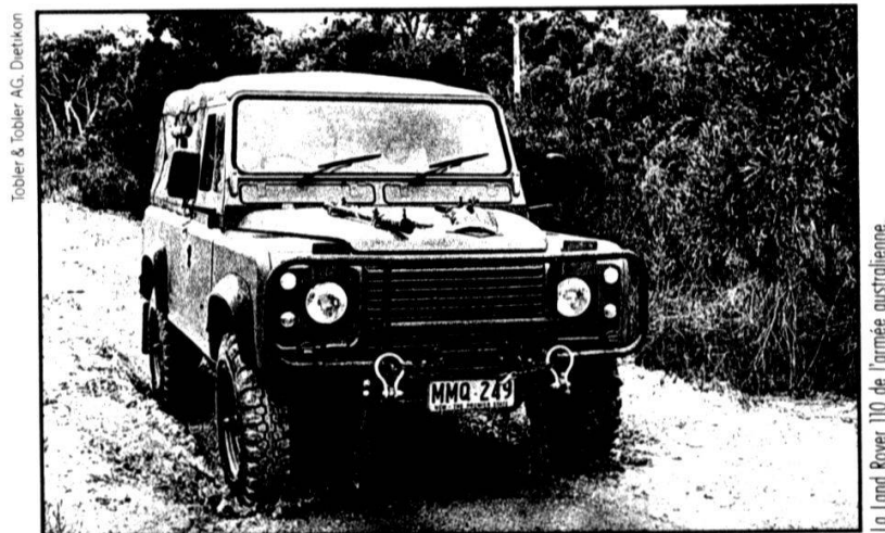
Tabler & Tabler AG, Dietikon