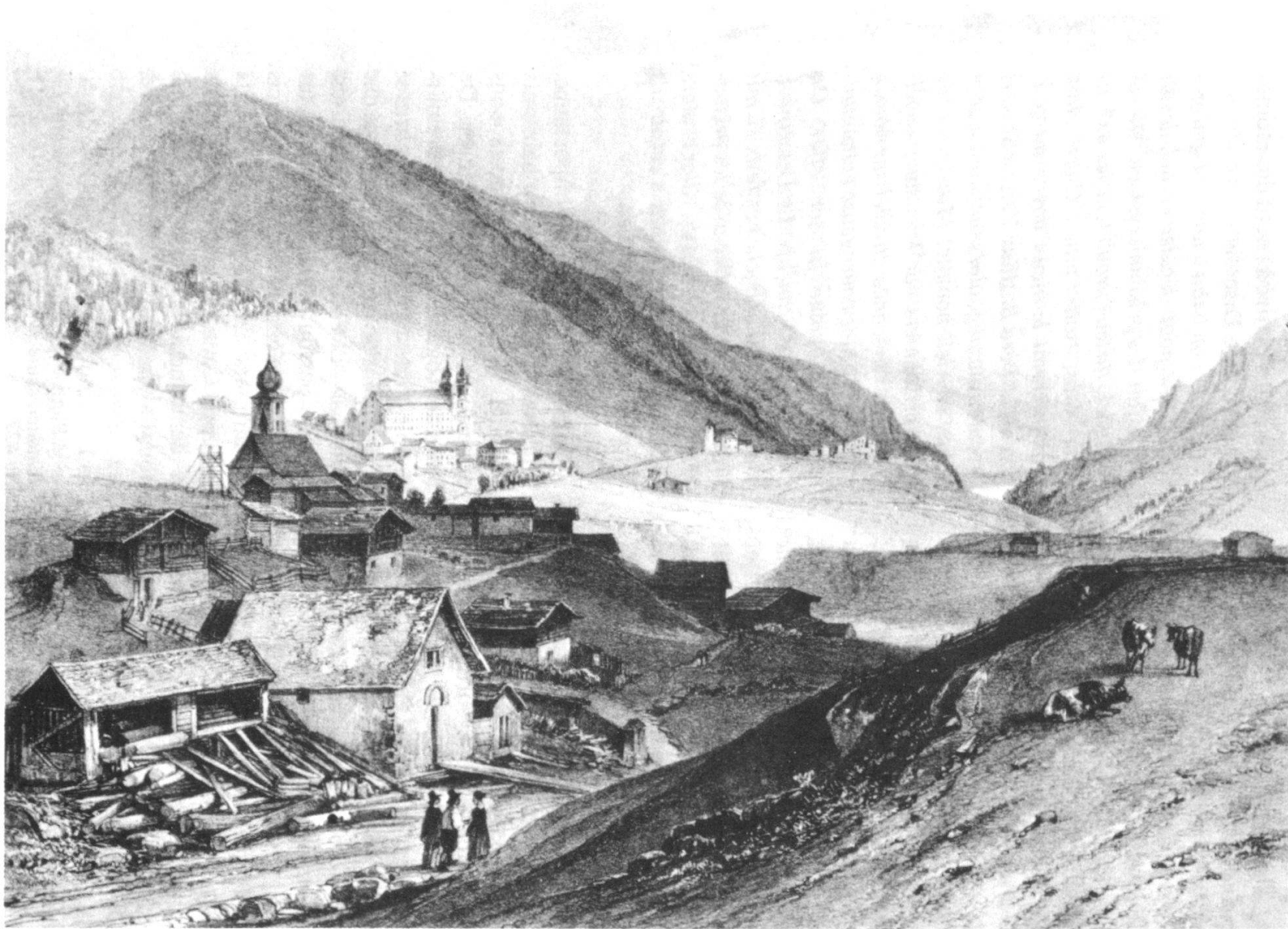
Disentis ver 1830. Lithographie par J. Jacottet d'après Chapuy.