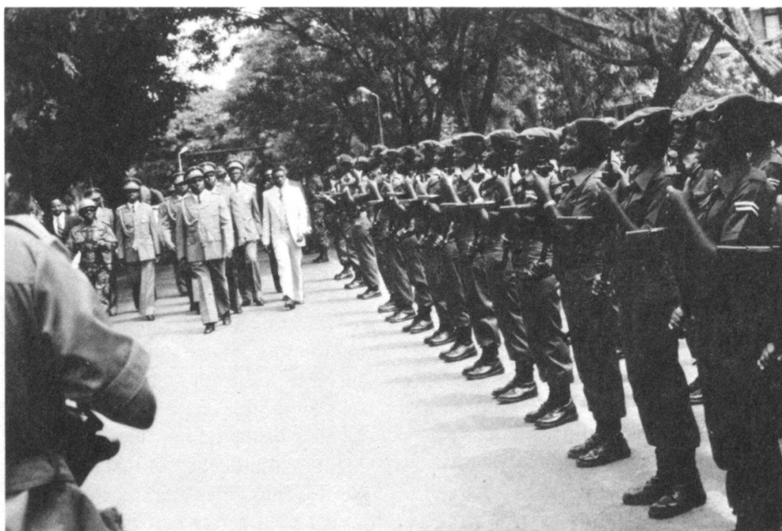
Personnel féminin inspecté par le Chef de l'Etat

La gendarmerie nationale est chargée, en priorité, de lutter contre les troubles et de les prévenir. Elle porte