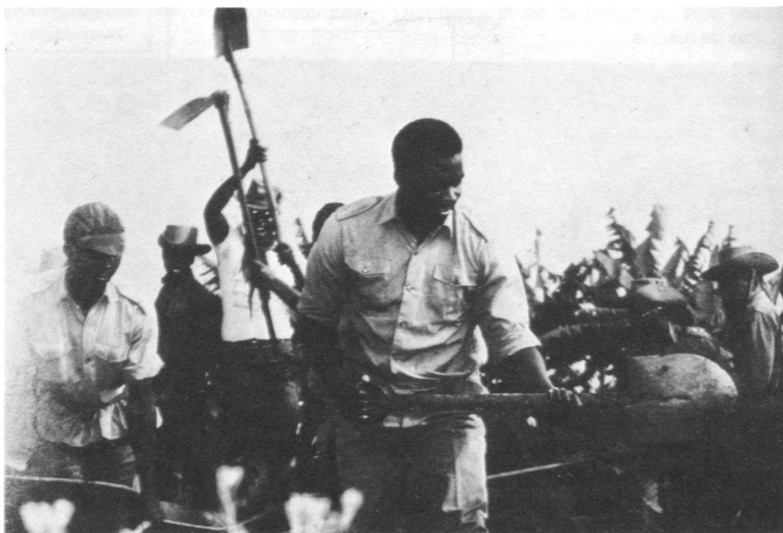
Au premier plan, le général Habyarimana, président de la République, participant aux travaux communautaires de développement. « Prêcher par l'exemple, la place est à l'action. »

L'agro-pastoral est un domaine d'activité privilégié par les militaires, puisque le Rwanda est un pays à vocation agricole. Selon les régions, on cultive du café, du thé, du quinquina, du pyrèthre, des pommes de terre ou des légumes, de façon à réaliser soit l'autosuffisance alimentaire, soit des revenus substantiels contribuant à alléger le budget des Forces armées. Il en va de même pour l'élevage des vaches, des cabris, des