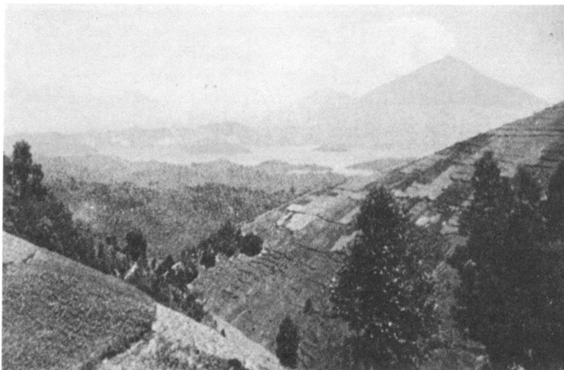
« Le pays des mille collines »

Tous les Rwandais parlent une même langue, le kinyarwanda; le français est une langue officielle et administrative. Le pays connaît une