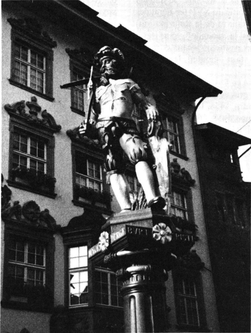
Fontaine du tireur, Schaffhouse