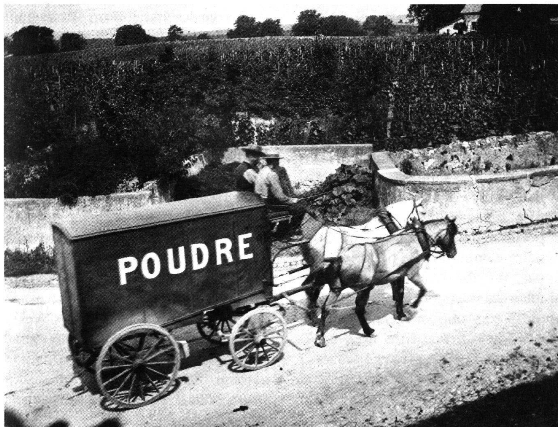
En 1885, sur la route Aubonne–St-Prex