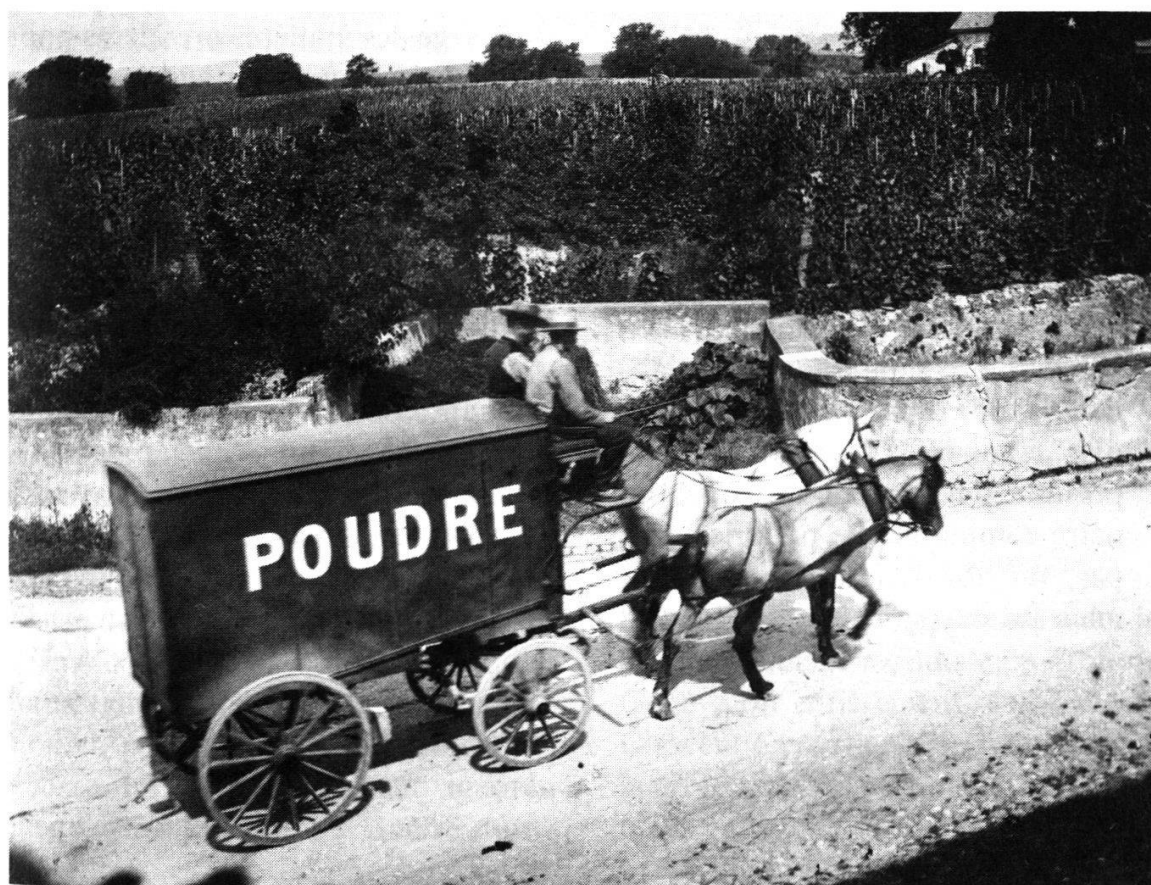
En 1885, sur la route Aubonne-St-Prex