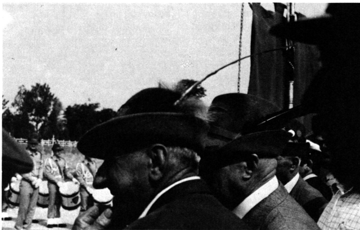
Face à la fanfare de la «Julia», les anciens apportent leur parrainage.