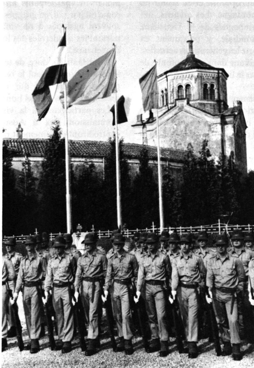
Les manifestations de l'ANA soulignent l'esprit européen. Ici au cimetière autrichien de Cittadella, avant la pose de la plaque commémorative, une section d'honneur a été déléguée par la brigade « Julia ».