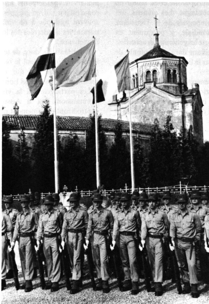
Les manifestations de l'ANA soulignent l'esprit européen. Ici au cimetière autrichien de Cittadella, avant la pose de la plaque commémorative, une section d'honneur a été déléguée par la brigade « Julia ».