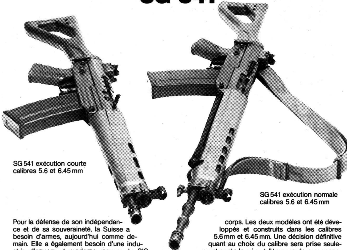
SG 541 exécution courte calibres 5.6 et 6.45 mm