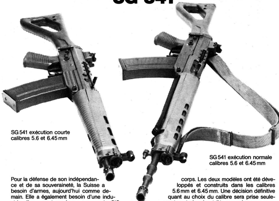
SG 541 exécution courte calibres 5.6 et 6.45 mm