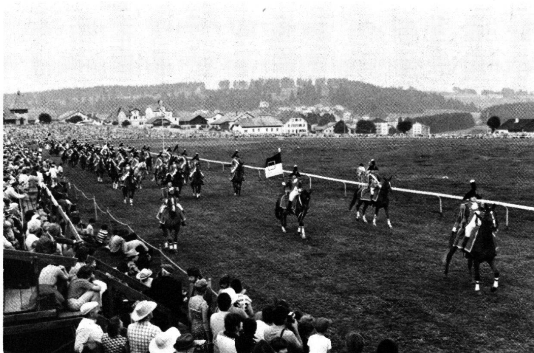
Le Cadre Noir et Blanc lors de sa première sortie à Saignelégier, en août 1980.