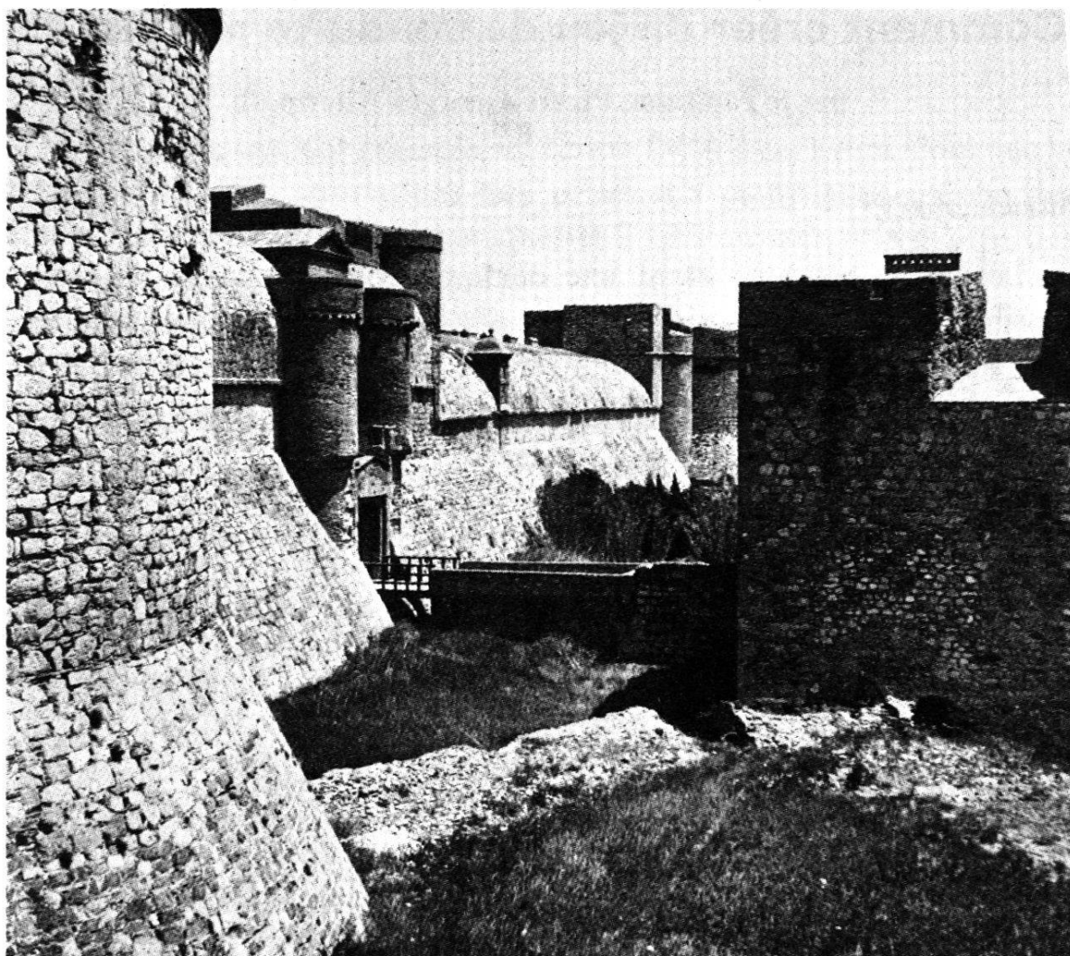
Fossé du front nord avec l'entrée de la forteresse

pour éviter de voir l'ennemi s'en servir (à l'époque de Richelieu) ou pour alléger les charges d'entretien des fortifications (à l'époque de Vauban). Poudrière, prison d'Etat ou casernement occasionnel, Salses est finalement classée monument historique en 1886. Affectée dès 1930 à l'Administration des beaux-arts, cette forteresse extraordinaire est l'objet de grands travaux de restauration, de sorte que l'homme d'aujourd'hui trouve, si ce n'est dans la visite, du moins dans la lecture de cette étude si vivante, le reflet d'une époque de grandeur dont l'architecture est le témoin privilégié.