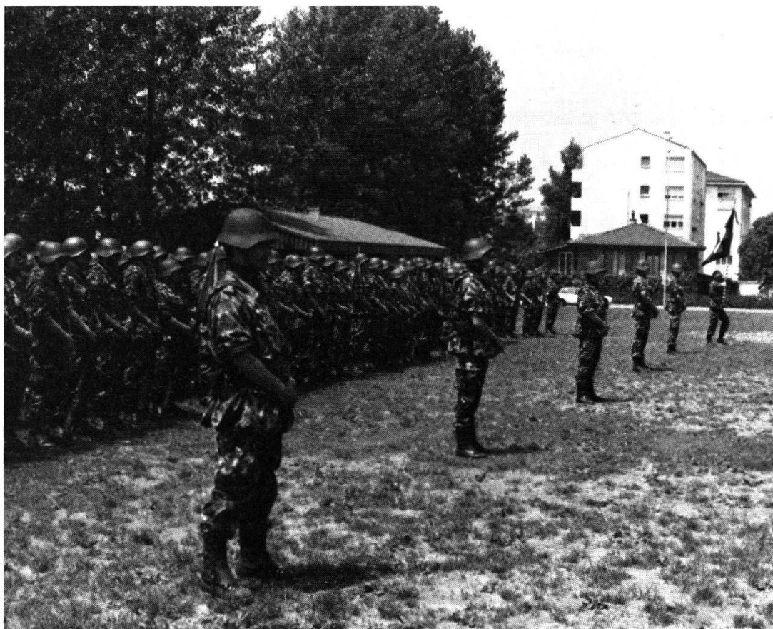
CR 1979: Prise du drapeau à Bussigny

Cependant, l'idée des promoteurs faisait son chemin et d'autres initiatives eurent plus de succès. A l'éphémère société de 1824 succédèrent plusieurs sociétés communales de carabiniers (1828-32), la Section des carabiniers fédéraux (1832), la Société cantonale des carabiniers (1848), les Abbayes de carabiniers de 1872 et 1875. Ces deux dernières manifestations, qui avaient remporté un très grand succès,