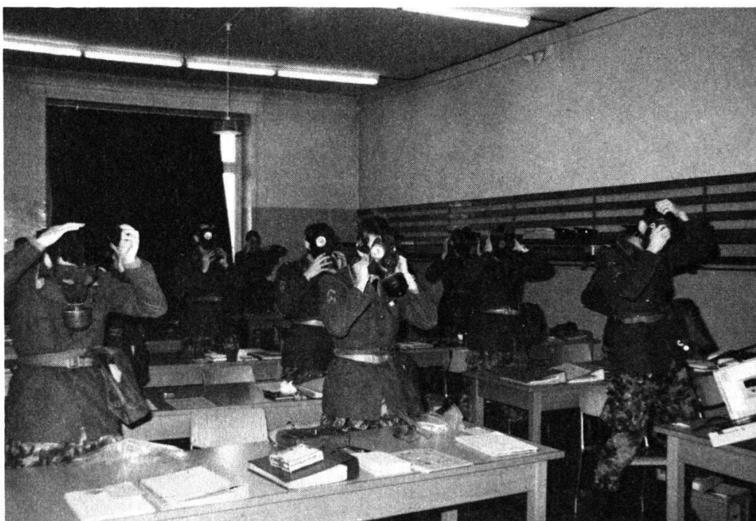
Drill et port du masque de protection pendant une longue durée lors de l'instruction théorique.

Dans le domaine des efforts physiques, la condition des aspirants fait l'objet d'un entraînement progressif et très varié. Natation avec possibilité d'obtenir après avoir subi avec succès un examen le brevet I de la Société Suisse de Sauvetage. Gymnastique en salle et dans le terrain, combat rapproché, courses d'orientation de jour et de nuit, course d'endurance de dix kilomètres en tenue de combat, marches de section et courses de patrouille. Durant cette période et dans le but de