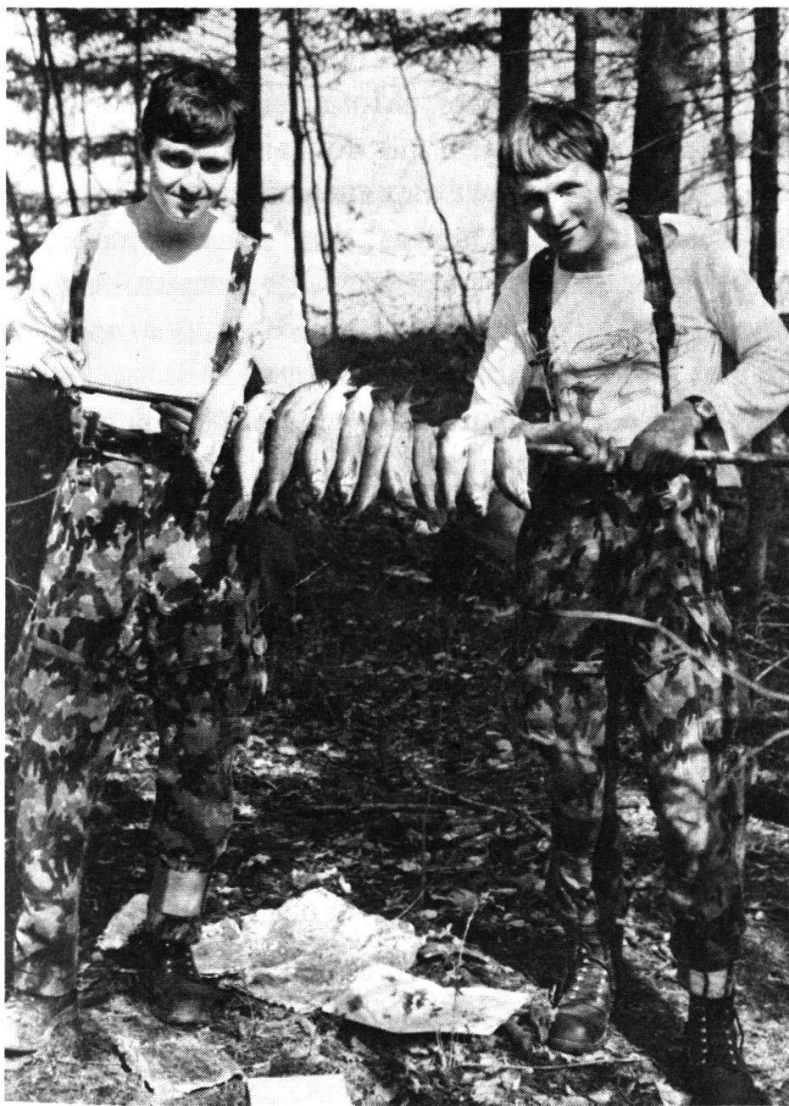
Préparation du repas. Moment bienvenu lors de l'exercice de résistance.

La huitième semaine voit se dérouler le premier exercice de grande envergure. Des états-majors ad hoc de bataillon, avec les maîtres de classe fonctionnant comme commandant, sont constitués pour cet exercice appelé «FURIOSO». Phase de mobilisation de guerre, travaux de planification, prises de décision pour l'engagement d'un bataillon de fusiliers dans la défense, changement de PC, tel est le programme de cet exercice, pénible pour tous les participants qui vivent et travaillent dans des PC et cantonnements de fortune.