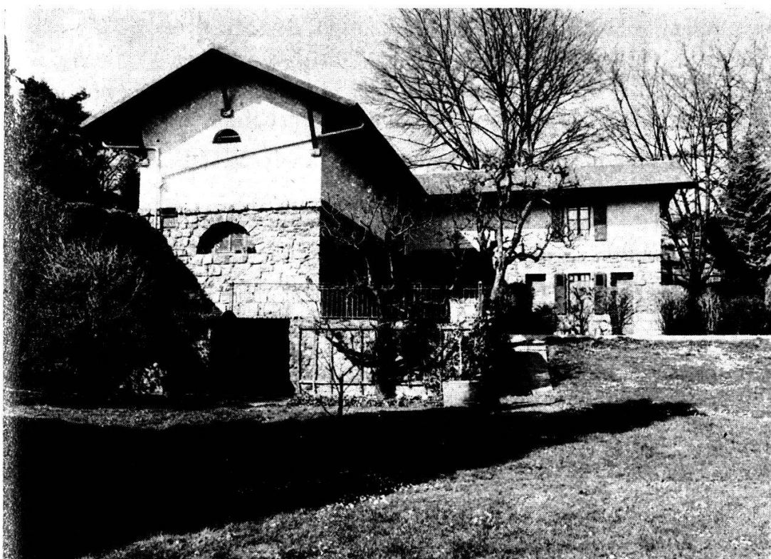
Pavillon de recherches Général Guisan,

il sera possible de poursuivre les travaux et de constituer au rez-de-chaussée une salle de réunions et de conférences, au premier étage une bibliothèque et une salle de travail, dans une partie de l'aile sud du bâtiment un laboratoire photographique et des locaux d'archives.