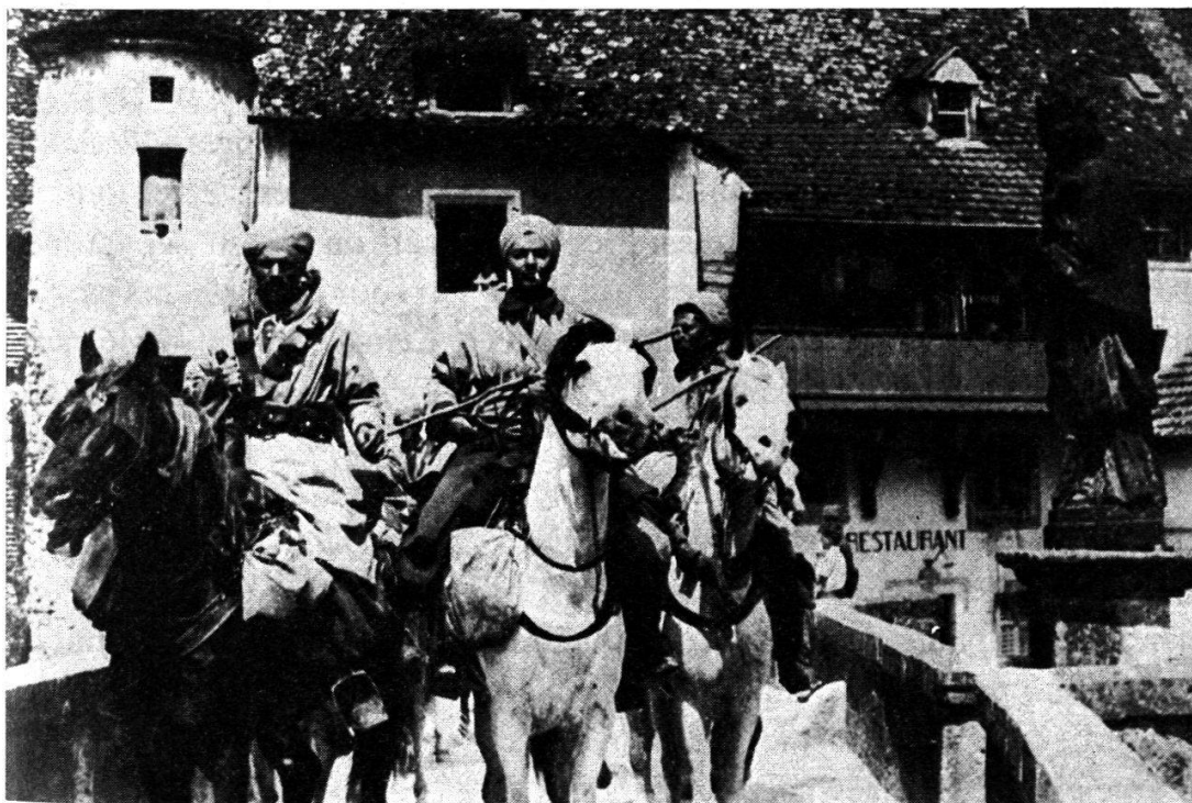
Des spahis internés traversent le Doubs à St-Ursanne (1940).