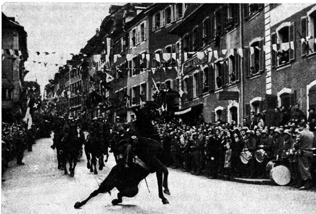
Officier d'infanterie en mauvaise posture lors d'un défilé à Porrentruy, pendant la deuxième guerre mondiale.

peu amènes à l'égard des Romands, désigne le régiment 9 pour maintenir l'ordre dans la ville des bords de la Limmat. La personnalité du lieutenant-colonel Guisan contribue largement au bon accomplissement de cette mission, car ce chef se soucie des problèmes sociaux, allant jusqu'à créer un fonds de secours pour ses hommes.