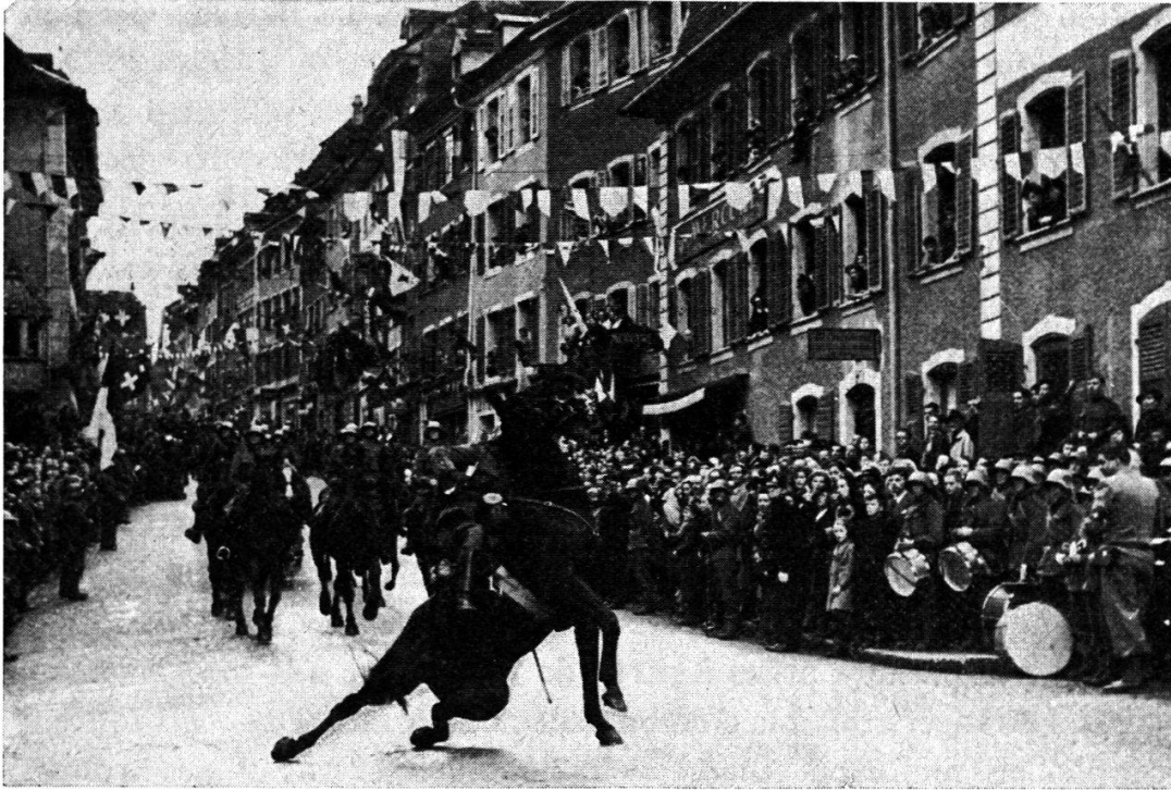
Officier d'infanterie en mauvaise posture lors d'un défilé à Porrentruy, pendant la deuxième guerre mondiale.

peu amènes à l'égard des Romands, désigne le régiment 9 pour maintenir l'ordre dans la ville des bords de la Limmat. La personnalité du lieutenant-colonel Guisan contribue largement au bon accomplissement de cette mission, car ce chef se soucie des problèmes sociaux, allant jusqu'à créer un fonds de secours pour ses hommes.