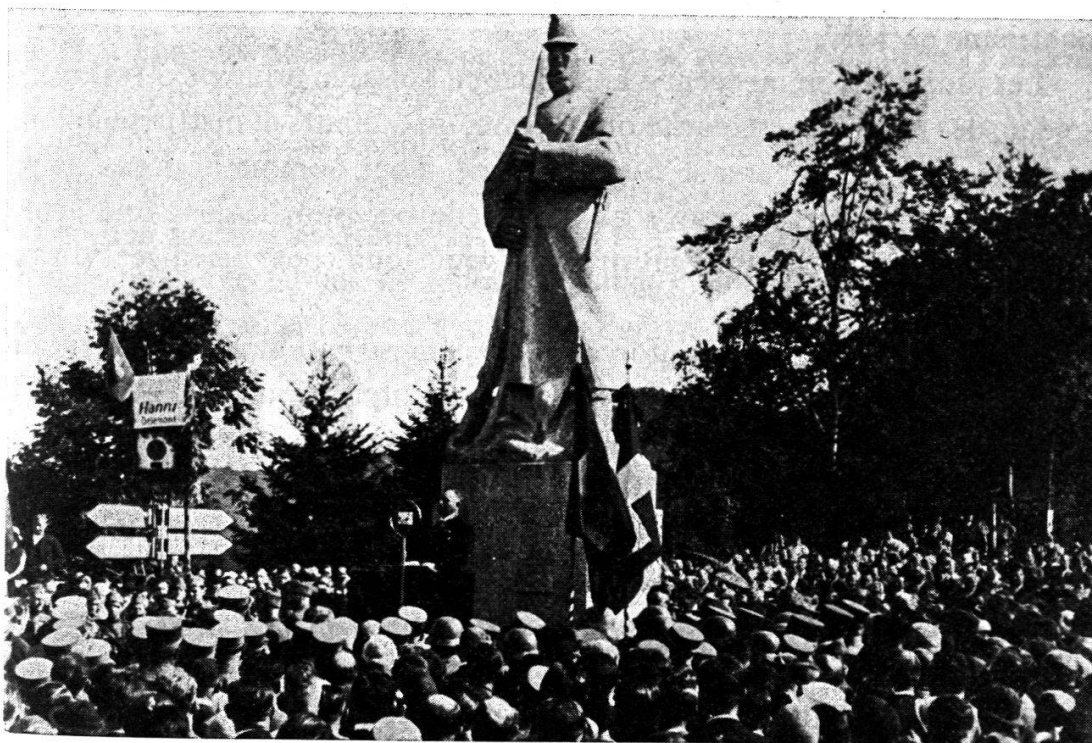
Le « Fritz » des Rangiers, symbole de patriotisme. 1934: célébration du vingtième anniversaire de la mobilisation.