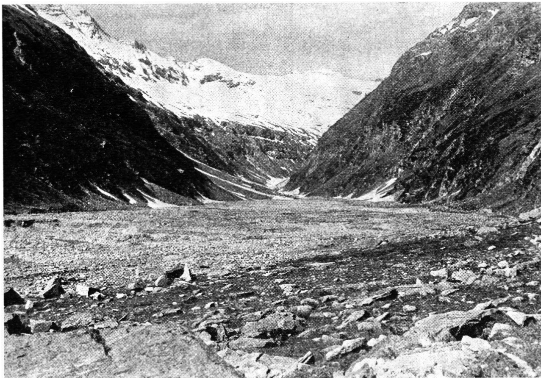
Place de tir de Hinterrhein

En omettant les places d'exercice et de tir occasionnelles, parce que d'accès difficile ou de rendement limité par un terrain trop exigü ou trop montagneux, on peut dresser de nos places d'exercice et de tir pour blindés le tableau des deux pages suivantes.