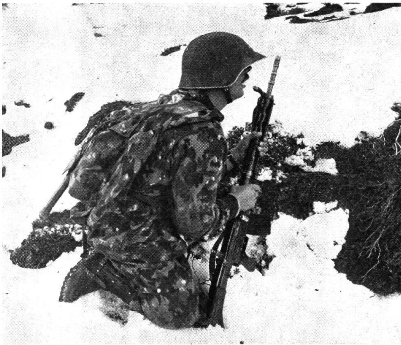
Dans le cadre d'une section de fusiliers, un sous-officier donne son ordre à son groupe.

Ces différents moyens de combat sont engagés dans le cadre de la section de fusiliers. Il y a trois sections de fusiliers dans une compagnie. Celle-ci comprend en plus une section de mitrailleurs dont le feu appuie l'action des fusiliers.