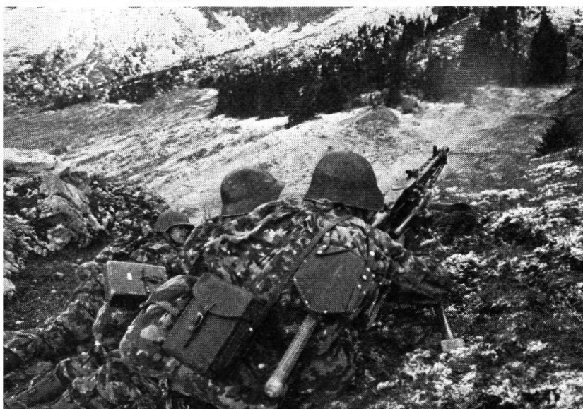
Un groupe de mitrailleurs appuie les fusiliers par son feu.